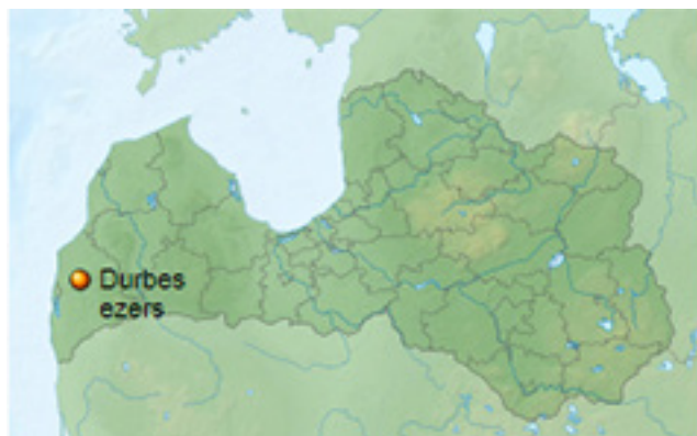
Durbės ežero vieta Latvijos žemėlapyje.