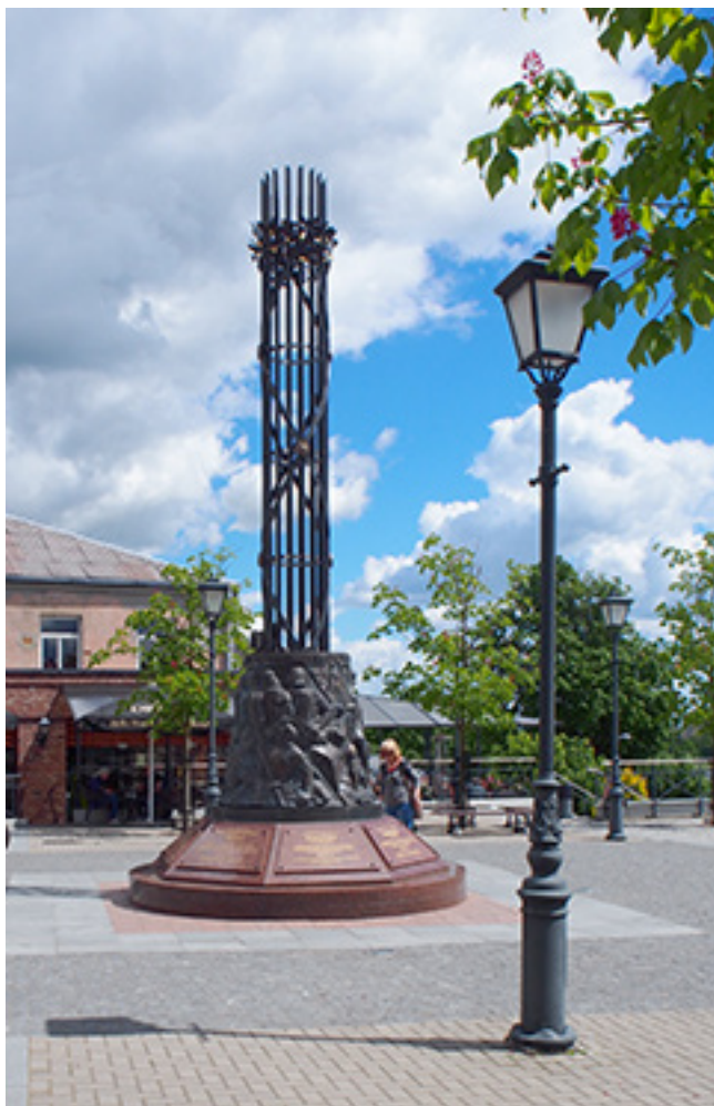
Paminklas, skirtas Durbės mūšio (1260 m.) atminimui įamžinti, Telšių miesto centre (Respublikos gatvė, Durbės skverelis). Idėjos autorius – Algirdas Žebrauskas, paminklo gereljefo autorius – skulptorius Algirdas Bosas, paminklo metalinės dalies autorius – kalvis Virginijus Mikuckis.

Žūt būtinei kovai iš visos Žemaitijos buvo sutelkta didelė žemaičių kariuomenė.