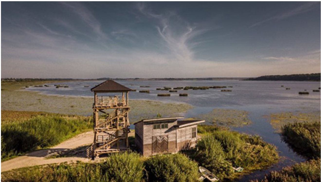
Durbės ežeras.