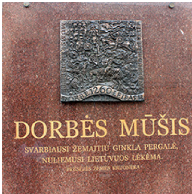
1260 m. įvykusiam Durbės mūšiui skirta granitinė plokštė Didžiojoje Žemaičių sienoje Telšiuose (skulptorius Petras Gintalas).

Jau XIII a. pradžioje, formuojantis Lietuvos valstybei, išryškėjo du stiprūs teritoriniai-gentiniai branduoliai – Žemaitija ir Lietuva. Panašus karinės jėgos balansas, karybos patirtis lėmė, kad santykiai tarp jų buvo gana rezervuoti. Stulbinama Žemaitijos kariuomenės pergalė 1236 m. Saulės mūšyje,