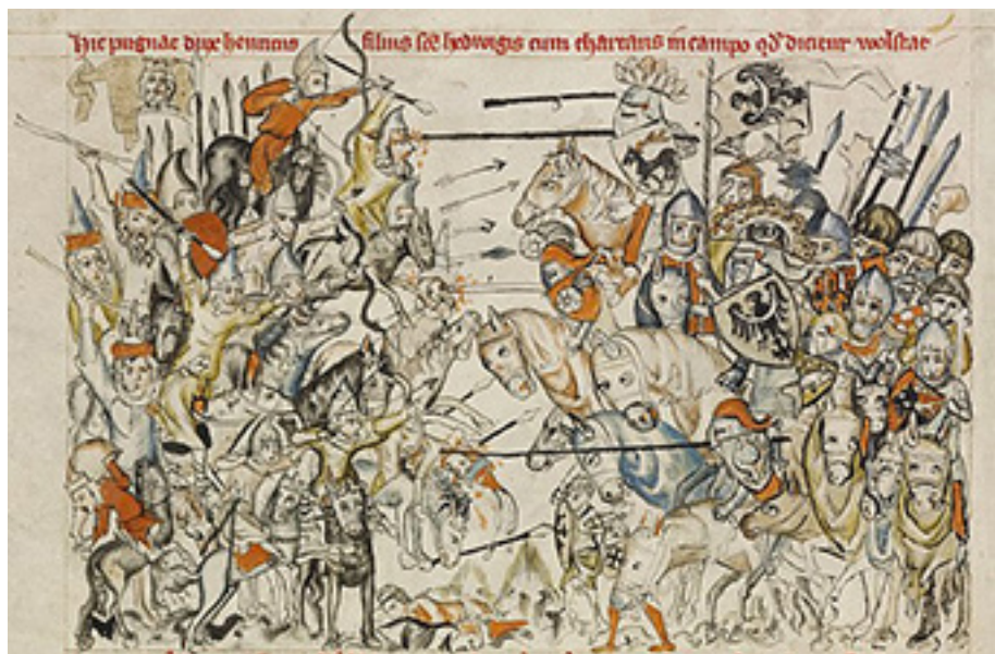
„Durbės mūšis“. Kūrinių autoriai nežinomi. Iliustracijos iš http://www.imperialteutonicorder.com/id90.html