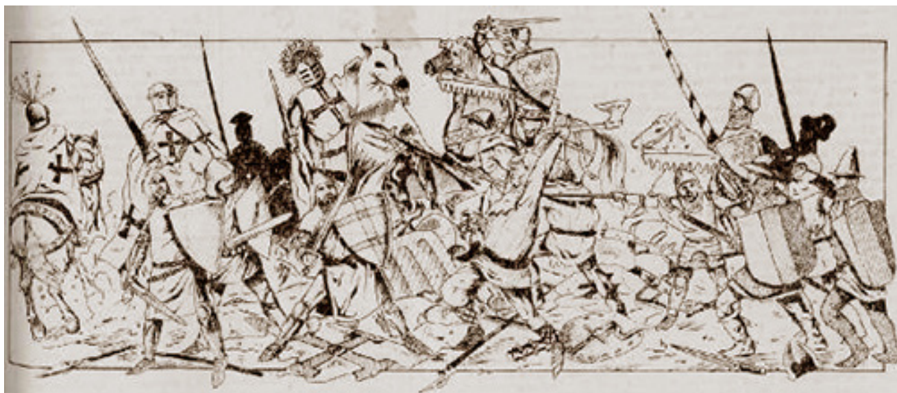
„Durbės mūšis“. Dailininkas nežinomas.