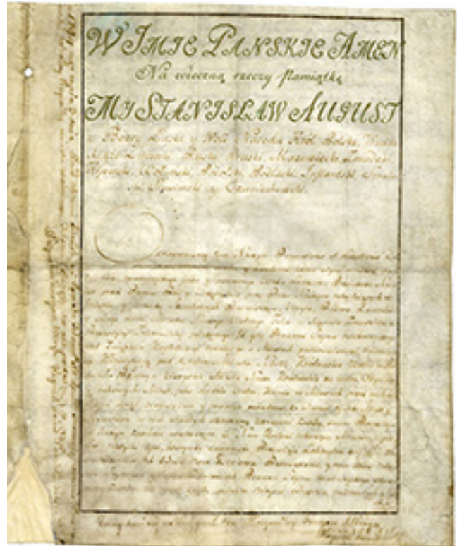
Telšių miestui 1791 m. gruodžio 6 d. suteiktos privilegijos pirmasis lapas. ŽMA GEK 6.551

Telšių savivaldos ir herbo atsiradimas glaudžiai susijęs su XVIII a. pabaigos įvykiais valstybėje. ATR visuomenė, išgyvenusi pirmąjį valstybės padalijimą, stengėsi pasukti reformų keliu. 1788 m. į to meto valstybės sostinę Varšuvą susirinkęs Seimas posėdžiavo iki 1792 m. ir