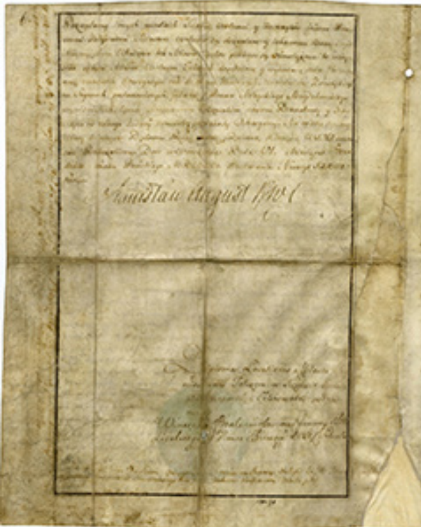
Telšių miestui 1791 m. gruodžio 6 d. suteiktos privilegijos ketvirtasis lapas. ŽMA GEK 6.551