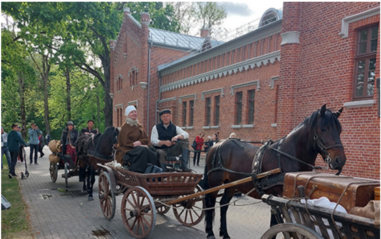
Plungės kunigaikščių Oginskių dvaro sodyboje – kinkinių žemaitukų žirgais sutiktuvės. 2023 m. gružės 27 d.

Šiomet sukanka 100 metų, kaip Plungėje dvaro sodyboje buvo įsteigtas valstybinis žemaičių veislės arklių žirgynas. Šio dvaro teritorijoje dabar veikian-