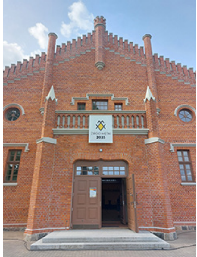
Plungės kunigaikščių Oginskių dvaro sodybos žirgyno pastato fragmentas

Gintautas ČIŽIŪNAS