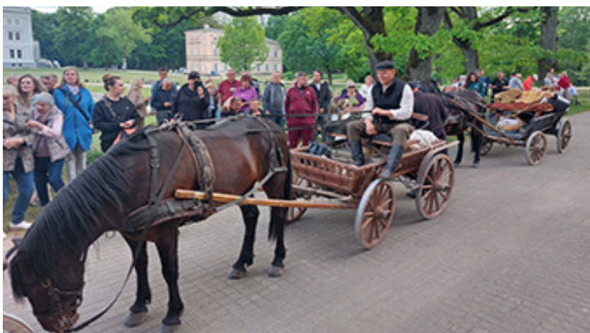
Plungės kunigaikščių Oginiskių dvaro sodyboje vykusių kinkinių žemaičių žirgais sutiktuvės. 2023 m. gegužės 27 d.

„Akcijos, žygiai ir konkursai“. Vienas iš pagrindinių renginių – šių metų gegužės 27 d. Žemaičių dailės muziejuje įvykęs Plungės valsstybinio žemaičių veislės arklių žirgyno 100-mečio minėjimo renginys-mokslinė konferencija „Nacionalinė žemaitukų žirgų veislė: istorija, išsaugojimas ir aktualijos“ bei fotografijų paroda ir žemaitukų žygis Plungė–Niūronis. Už šių renginių organizavimą buvo atsakinga Žemės ūkio ministerija, Žemaičių dailės muziejus, Žemaitukų arklių augintojų asociacija ir Arklio muziejus.