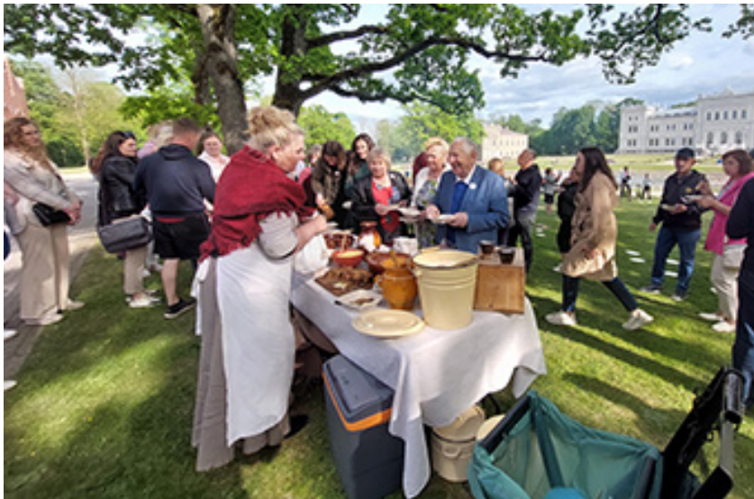
Plungės kunigaikščių Oginiskių dvaro sodyboje vykusių Žirgo metams skirtų renginių dalyvius vaišėmis lepino šaunios žemaičių šeimininkės