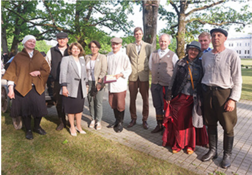
Plungės kunigaikščių Oginiskių dvaro sodyboje 2023 m. gegužės 27 d. vykusių Žirgo metams skirtų renginių organizatoriai ir svečiai