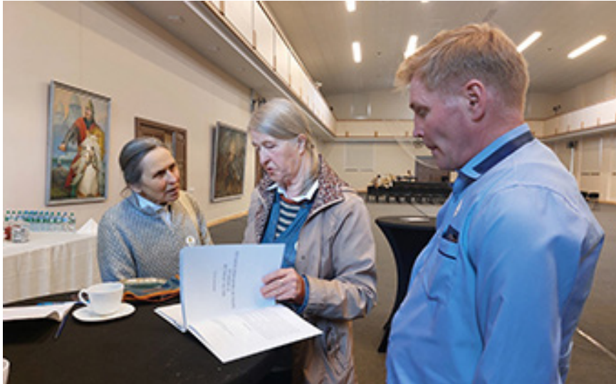
Konferencijos „Nacionalinė žemaitukų žirgų veislė: istorija, išsaugojimas ir aktualijos“ pertraukėlių metu pranešėjams netrūko klausimų