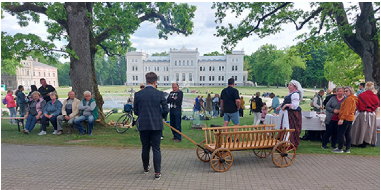
Renginių dalyviai Plungės kunigaikščių Oginskių dvaro sodyboje 2023 m. gegužės 27 d.