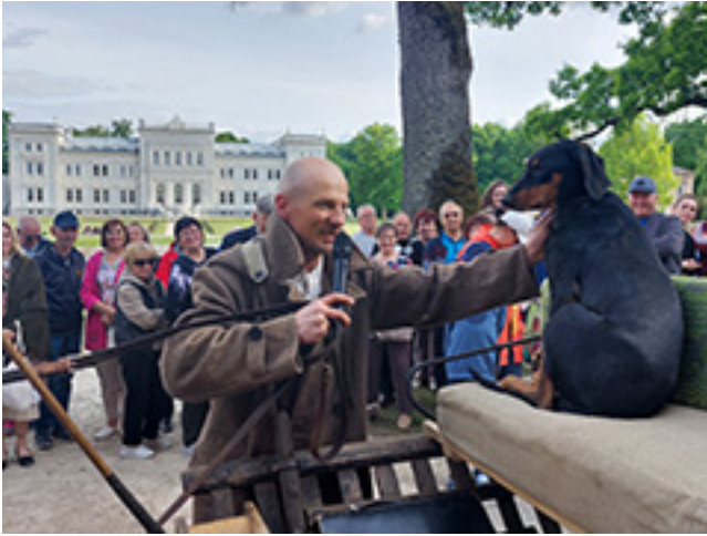
Plungės kunigaikščių Oginskių dvaro sodyboje vykusių kinkinių žemaitukų žirgais sutiktuvių akimirkos