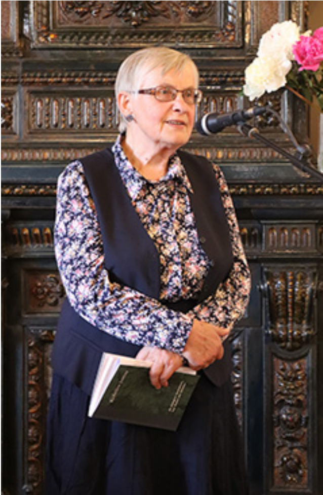
Literatūrologė akademikė Viktorija Daujotytė