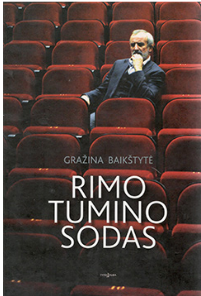
Gražinos Baikštytės knygos „Rimo Tumino sodas“ (Vilnius, 2012) viršelis

Režisierius priklauso tai teatro menininkų kar-