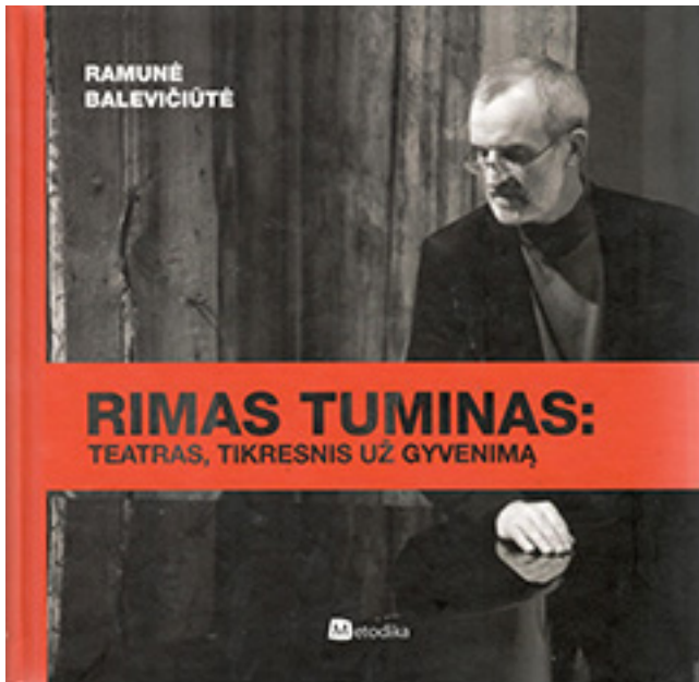
Ramunės Balevičiūtės knygos „Rimas Tuminas: teatras, tikresnis už gyvenimą“ (Vilnius, 2012) viršelis

tuvos muzikos ir teatro akademijoje, čia jam 2013 metais suteiktas akademijos Garbės daktaro vardas.