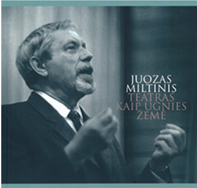
Panevėžio apskrities Gabrielės-Petkevičaitės-Bitės elektroninio leidinio „Juozas Miltinis. Teatras kaip ugnies žemė“ (Panevėžys, 2017) viršelis

atkakli ir tikslinga, su tvirtu gyvenimo prasmės pojūčiu asmenybė. Dabar, žvelgiant per laiko atstumą, galima matyti jo kūrybinių užmojų rezultatus – sukurtas intelektualinės ir filosofinės minties teatras, režisuota ir į teatro sceną perkelta apie 90 spektaklių, organizuota ir įkurta daugiau panašių analogų Lietuvoje neturinti, prie Panevėžio dramos teatro veikusių aktorių rengimo studija. Tokios išskirtinės asmenybės įdomios ir jų gyvenimo bei veiklos laikotarpiu, ir tada, kai nutolsta nuo savo tiesioginės veiklos, pasitraukia iš aktyvaus kūrybinio gyvenimo sūkurio, tačiau niekada nesustoja – užsiima saviugda ir savikūra. [...]