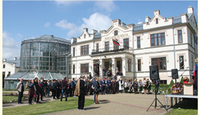
Šventė Kretingos muziejuje.

2022-ųjų metų lapkričio 16 d. Telšių kultūros centre atidaryta Lietuvos teatro, muzikos ir kino muziejaus parodos interaktyvi mobili paroda „Ar lengva būti pirmiems? Telšių XX a. pr. kultūrinis sąjūdis“, kurią lydi edukaciniai renginiai ir paskaitos, susitikimai su įžymiais Lietuvos menininkais ir mokslininkais, kultūros veikėjais, sulaukė didelio lankytojų susidomėjimo.