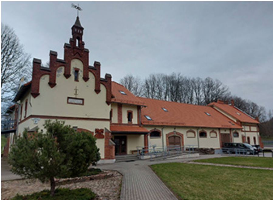
Vėžaičių dvaro pastatas, kuriame veikia Vėžaičių kultūros centras.