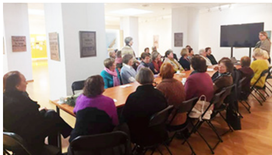
Plungėje vykusio edukacinio užsiėmimo, kuriame dalyvavo Trečio amžiaus universiteto lankytojai, akimirka.