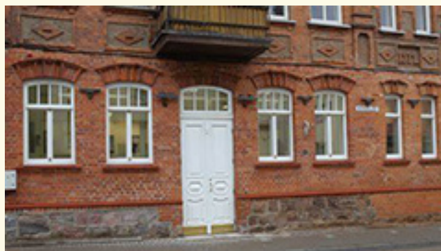
VDA Telšių galerijos pastatas (Kęstučio g. 3, Telšiai).