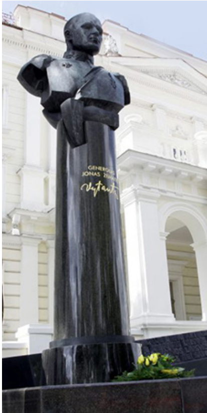
Paminklas „Generolas Jonas Žemaitis“ Vilniuje, prie Krašto apsaugos ministerijos (skulptorius G. Lukošaitis).