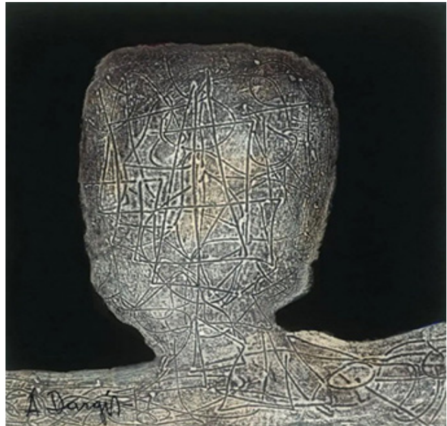
A. Dargis. „Matematikas“. 1984 m.

1941 metų rudenį sudariau sutartį vieneriems metams, kuri buvo pratęsta iki 1945 m. rudens. Dirbau šiuose teatruose: Eisenacho dramos ir Gotha operos, operetės (Tiuringija, Vokietija). Minėtų dviejų miestų teatrai turėjo vieną administraciją. Dramos ir operos pastatymais teatrai pasikeisdavo. Abiejuose teatruose tarnautojų dirbo apie 180–200. Čia buvo du dailininkai-dekoratoriai. Vasaros metu teatro darbuotojai turėdavo apie 9 savaites apmokamų atostogų. Aš apsigyvenau gražiame istoriniame Eisenacho mieste, įsikūrusiame tarp aukštų kalvų. Iki 1944 metų miesto nebombardavo, tad galėjome gyventi ramiai. Kažkodėl miesto gyventojai krautvininkai teatro darbuotojams, ansamblui buvo geranoriški. Pavyzdžiui, jeigu perki 100 gramų dešros, reikėdavo duoti 100 gramų dešros kortelę. Iš krautvininko (parduotuvės savininko) gaudavai ne 100 gramų dešros, bet 200 gramų, gal ir daugiau. Taip pat būdavo ir su kitais būtiniaisiais produktais (duodavo šiek tiek šypsodamiesi). Krautvininkai teatro kolektyvo narius pažinojo.