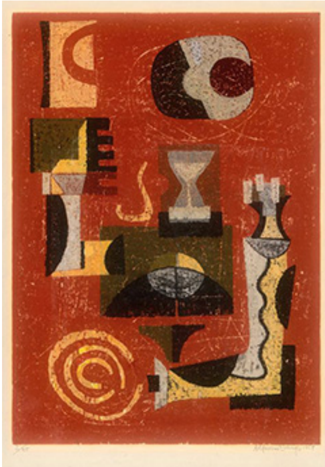
A. Dargis. „Smėlio laikrodis“. 1959 m.

trumpą laiką šias gėrybes išleidau į juodąją rinką.