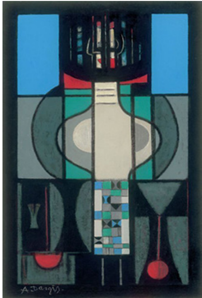
A. Dargis. „Stiklo mergaitė“. 1982 m.

Darbų koregavimo metu, per kūrinių aptarimus būdavau griežtas – iki ašarų. Kai kurios „Formos Art Studio“ lankytojos studiją lankė 12 metų, kitos – ne mažiau kaip 6 metus. Per užsiėmimus turėdavome pertrauką – gal vieną valandą. Žmona atnešdavo kavos ir sausainių. Tą pertraukos laiką dažnai naudodavome kuriamų ir jau sukurtų darbų aptarimams, kritikai. Jeigu kas sakydavo, kad dar-