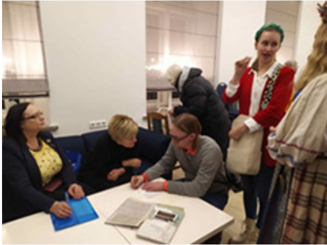
Vilniaus žemaičių kultūros draugijos nariams metiniai mokesčiai – privalomi