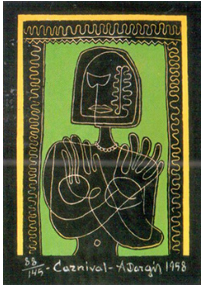
A. Dargis. „Karnavalas“. 1958 m.

1928 m. rudenį baigęs Mažeikių gimnazijos keturias klases, išvažiavau laikyti egzaminų į Kauno meno mokyklą. Per egzaminą davė piešti kubus. Esamus kubus piešiau, braižiau stambiomis linijomis, netušuodamas. Kai nutariau, kad mano darbas yra užbaigtas, turėjau išeiti iš salės. Egzaminus laikėm gal 40 asmenų. Kitą dieną egzaminų vertinimo komisija ant juodos lentos pakabino sąrašą