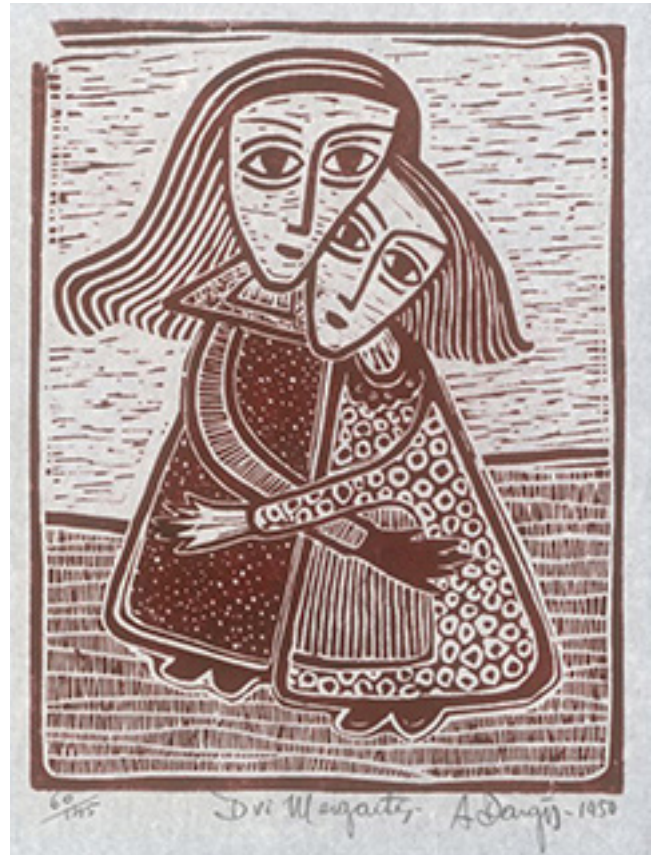
A. Dargis „Dvi mergaitės“. 1950 m. LNDM.

Sutartą dieną nuvažiuavau pas Tryškių kleboną