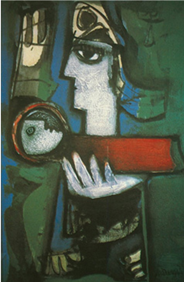
A. Dargis. „Be namų“. 1950 m. Nuotrauka iš RKIC archyvo

pelno (uždarbio) liko apie vienas tūkstantis litų.