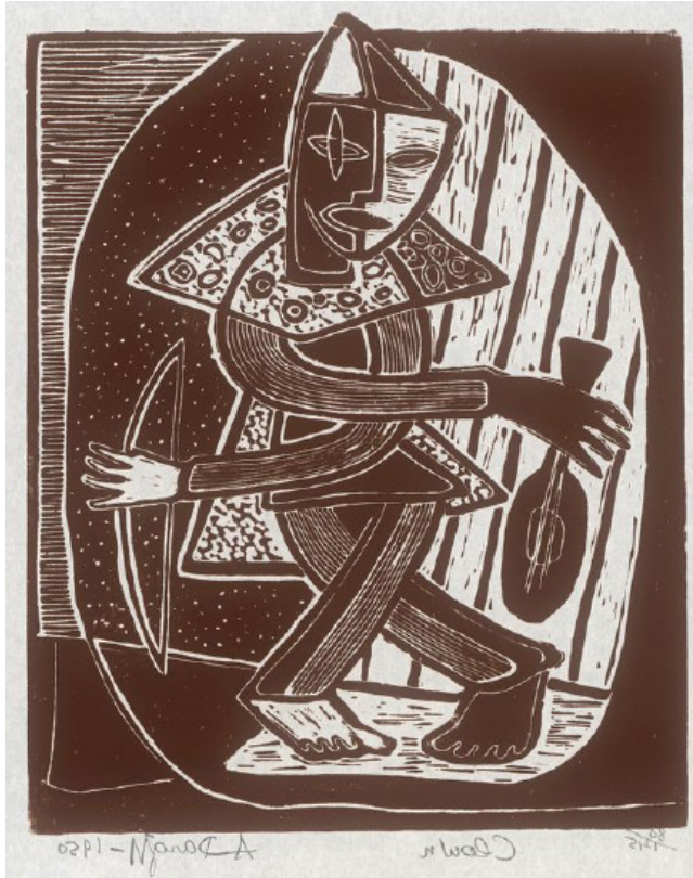
A. Dargis. „Klounas“. 1950 m. LNDM.

Toliau „Lapą“, rodo, leido žurnalistas Račkauskas.