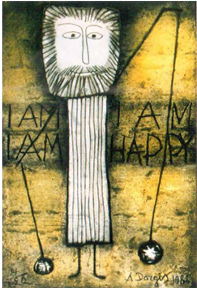
A. Dargis. „Esu laimingas“. 1988 m.

Prieš Kalėdų šventes parapijos klebonas su bažny-