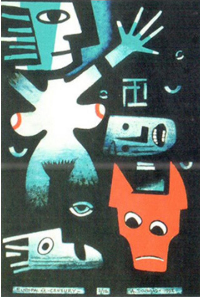
A. Dargis. „Europa. XX omžius“. 1992 m.

iškalbingesnis, sutelkęs daugiau emocinės galios, nei spalva. Jei priešyns – melodija, tai spalva jam – akordas.