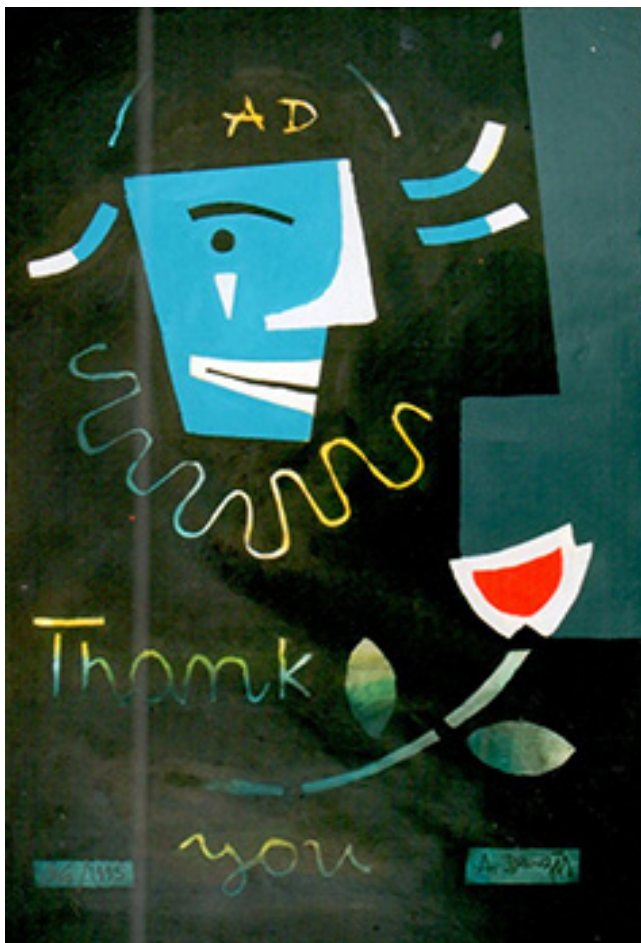
A. Dargė kūrėnis. Portėgrapėjė iš RKIC archĩva

aplinką. Savo kūriniuose išreiškiu tai, ką matau savo vidujiniame pasaulyje. Kai šis išvalgumas ir jėga jausti silpnėja, nustoju dirbti. Pakartoti ankstyvesnes formas, reiškia kūrybinį nuovargį. Aš nerimstu.“