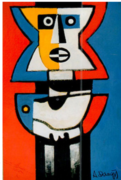
Dargė Al'puonsa kūrėnīs.

1996 metās, tās patēs, ka dailininks mērė, bova