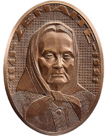
Rašytojos Žemaitės bareljefas. 1926 m. Skulptorius Petras Rimša

1912 m. Žemaitė persikėlė gyventi į Užupio pakraštyje esan-