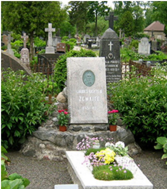
Rašytojos Julijos Beniūševičiūtės-Žymantienės (literatūrinis slapyvardis Žemaitė) kapas Marijampolės kapinėse.