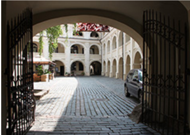
Vilniaus Alumnato kiemelio fragmentas

kūrėjų darbų pristatymo bei nuolat rengiamų edukacijų, bus kiek kitoks. Vienu metu Menų spaustuvėje susijungs trys tarptautiniai projektai, skirti jaunai auditorijai ir šiai auditorijai kuriantiems profesionalams. Projektai papildys ir praplės įprastą festivalio programą ir kvies pasitikti jauną, jau 700 metų turintį Vilnių.