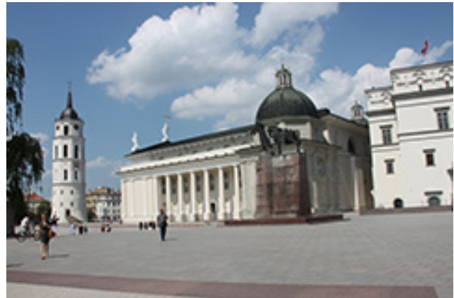
Vilniaus Katedros aikštė.

Vilniaus šviesų festivalis – ryškiausias Vilniaus