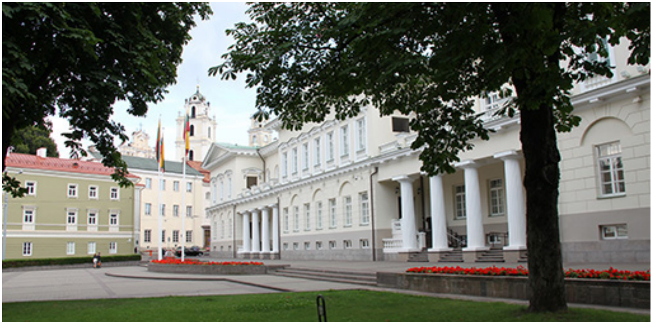
Lietuvos Respublikos prezidentūros ir Vilniaus universiteto pastatų, S. Daukanto aikštės Vilniuje vaizdas.

Išsami, patikslinta informacija apie Vilniaus miesto jubiliejinius 2023 m. renginius skelbiama čia > https://www.700vilnius.lt/jubiliejaus-programa/jubiliejiniai-sausio-menesio-renginiai/ .