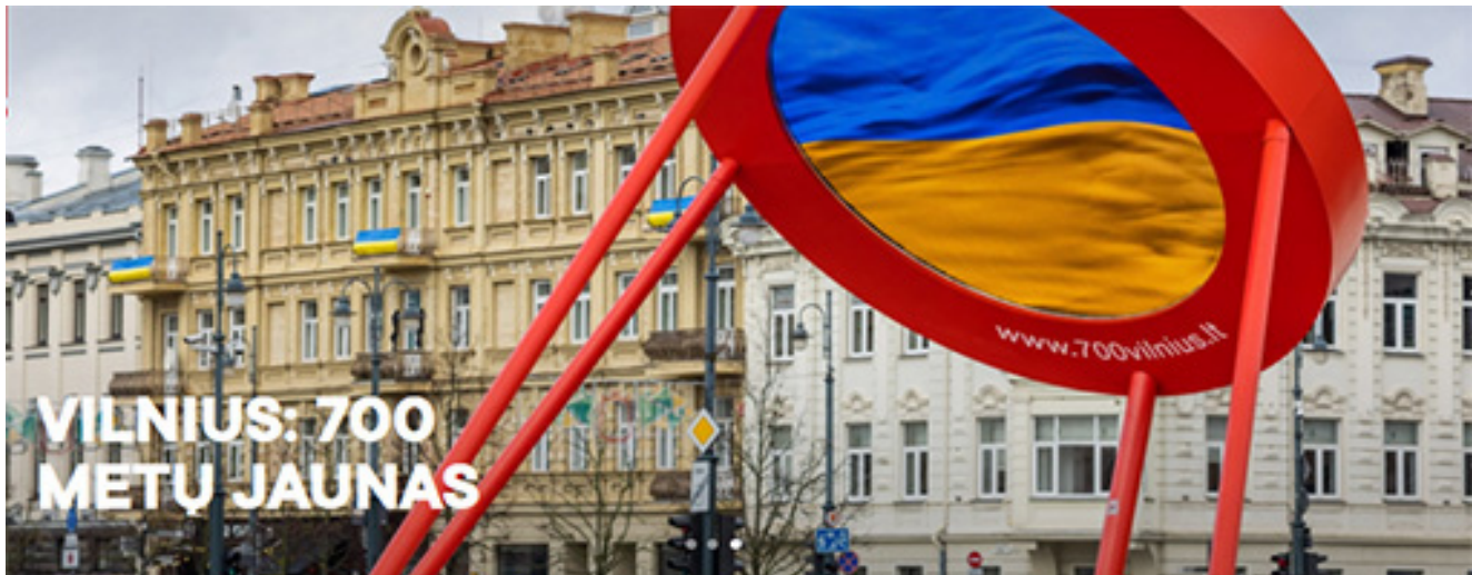
Leidinio „Vilnius 700“ https://www.700vilnius.lt/ iliustracijos fragmentas