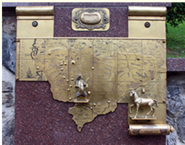
Pluokštė „Žemaitėjės konėgaikštītė“, dail. Inčirausks Romualds (Dėdiuosės Žemaitiu sėinas pluokštė). Sėinas idiejės autuorios – Žebrausks Algėrds. Vėngalė Bonifaca portrėgrapėjė

Lietuvuos istuorėjės vaduoveliūs vės dar matuom smarkė prītėmpta, unitarėnė valstībės puolitikā tarnaujėntė, paturbinta „Lietuvuos istuorėjė“, katruo ni so žvakė nagal rastė garbingas 800 m. (!)