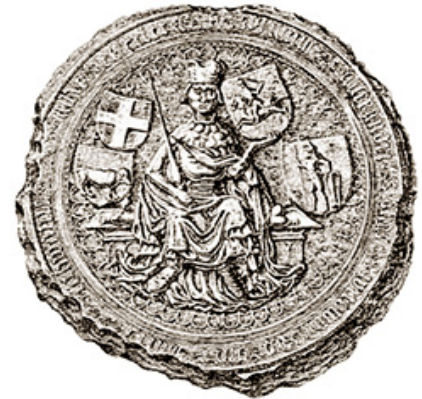
Vītauta Dėdiuojė portretinis ontspauds. Vītauts Dėdiesis Žemaitėms privilegėjė soteikė 1413 m.

Nieks nagal paneigtė fakta, ka meilė Tievīnė prasėded nu pagarbuos vėitā, koriuo augā. Dėltuo, je gėmė Žemaitėjuo, būdams Lietuvoos pilietis, pėrmiausė esi žemaitis. Šėndėin kultūras mažaraštė, tonkė eš aukšta žemaitėms, katrėi bene labiausė saug savasti, puorėn, ka švėisi Lietuvoos ateitės – tėn, kor ištrėnama tapatībė, tėn, kor vėskas sokas api ekonuomėka, api piningus ar gerbūvi... Gėrdo: „Nakorkem tautėniu getu...“, nes atsėlėksem, nes nabūsėm šiuolaikeškė, nes eš mūsa jouksės vėsos pasaulis... Kāp taiklė api tuokius