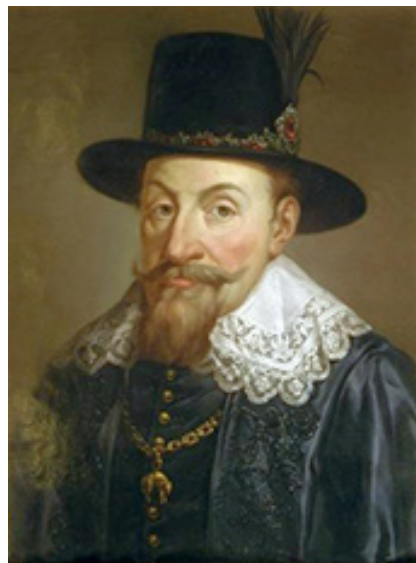
1566 m. gėmės, 1632 m. mērės Lietuvuos dėdiesis konėgākštis (1588–1632), Lėnkėjės karalios (1587–1632) Žigimants Vaza. Dail. M. Bocciarelli. Žematems privilegėjė soteikė 1588 m.

tas Euruopas valstībės, dalīvautė Euruopas regėjuonėnie puolitėkuo ėr gautė poikius ekonumėnius ėr kultūrėnius divėdėndus vėsā Lietuvā.