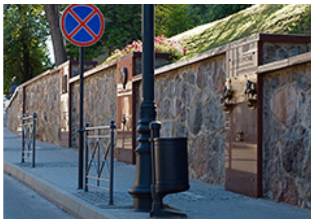
Dėdiuosės Žemaitiu sėinas (Telšė) fragmentės.

ISTUORĖNĖS EURUOPAS ŽEMĖS ŽEMAITĖJĖS istuorėjės, unikaliuos dualistinės (istuorėnė Žemaitėjė, istuorėnė Lietuva) mūsa valstībės