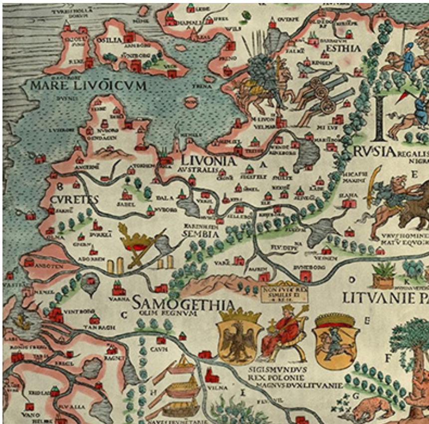
Žemaitējē. Fragmēnts iš Olaus Magnusa žemielapē Carta marina , 1539 m.

- „Tēp pat naskērsem anēms (žemaitēms) juokiū vaivadu ar tējūnu, išskīrus tus, katrus anēi patis išsērinks [...]“;