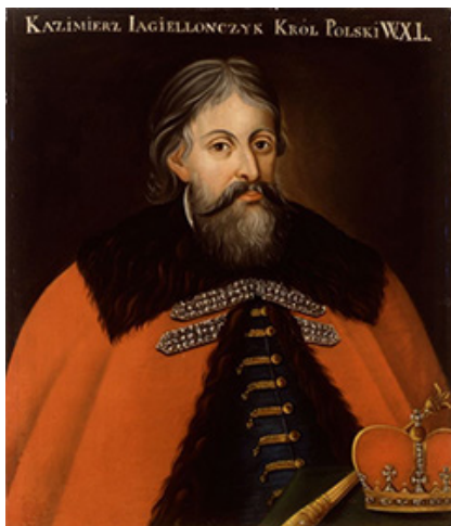
1457 m. gėmės, 1492 m. mērės Lietuvos dėdiesis konėgākštis (1440–1492), Lėnkėjės karalios (1447–1492) Kazimiers Juogailātis. Dailininks nežėnuoms privėlegėjė patvėrtėna 1441 m.

nie Telšiūs menininku sokortuos Dėdiuosės Žemaitiu sėinas vėnuos menėnės pluokštės – „Valduovu privėlegėjės Žemaitėjė“. Će rėk sostuotė, nes valduovu privėlegėju Žemaitėjė fakta muokikluos skėrtuo „Lietuvuos istuorėjuo“, kap ėr daug kėtū svarbiū Žemaitėjės istuorėjės faktū, tėp pat naraseem. Ožmėrša... Mieginsu primintė.