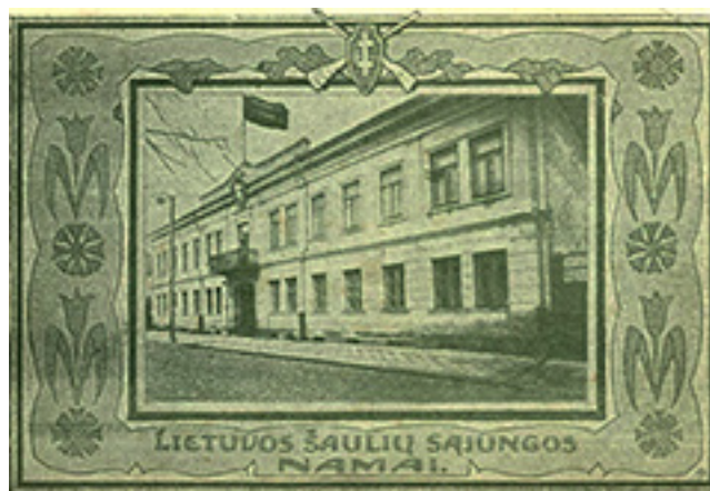
Viršuje – atvirukas „Lietuvos šaulių sąjungos namai“. 1926 m.; kairėje – 1939 m. skulptoriaus Petro Rimšos sukurtas medalis, kuriame yra užrašas „Vladas Putvys-Putvinskis (1873–1929) Lietuvos šaulių sąjungos įkūrėjas“, aversas

muose buvo auklėjami lietuviška dvasia. Vladas iš pradžių buvo mokomas namie, vėliau žinias gilino Šiaulių gimnazijoje, o nuo ketvirtos klasės – Mintaujos realinėje mokykloje, kurią baigė 1893 metais. 1894–1896 m. studijavo žemės ūkio mokslus Vokietijos Halės universitete. Jis buvo baigęs tik du semestrus, kai pablogėjo tėvo sveikata, tad turėjo studijas nutraukti ir sugrįžti namo. Parvažiavęs įsikūrė Grauzikuose. Iš tėvų paveldėjo Šilo Pavėžupio, Grauzikų ir Palendrių dvarus (paskutinią greitai pardavė).