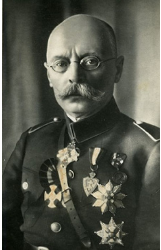
Vladas Putvinskis-Pūtvis (1873–1929).

Vladas Putvinskis-Pūtvis gimė 1873 m. spalio 6 d.