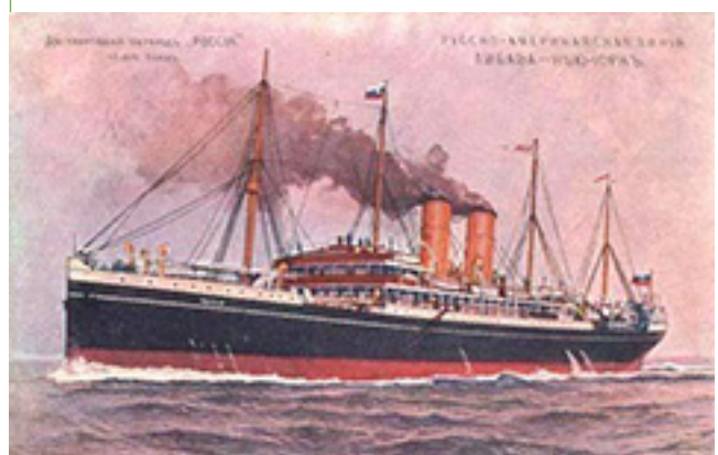
Laivai, kuriais plaukiojo Liudvikas Stulpinas (nuo viršaus): „Birma“; laivas, kuriame L. Stulpinas dirbo kapitonu Pirmojo pasaulinio karo metais; „Lithuania“; „Russia“.