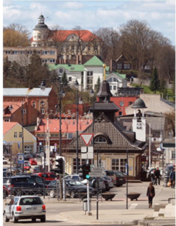
Telšiū senamiestē vaizds. Žebrauskē Algērda portēgrapējē

Tēms, katrēms heraldēka ir vākū zabuova, katrēi linksmā pri bokala alaus gal lēstē sau nusprēstē, kuoks tor būtē „tēkros Žemaitējēs herbs“, primin-so, kad MEŠKA BA ONTKAKLĒ ĪR B E R L Ī - N A HERBS – NA ŽEMAITĒJĒS.