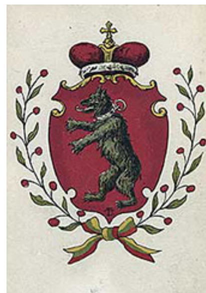
Daugėrda Tada sokorts Žemaitėjės herbs. XX a. I p. ėšleista atvėrėlė fragmėnts