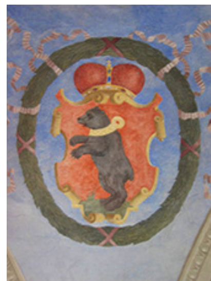
XVI–XVIII a. nauduoats Žemaitėjės konėgaikštistės herbas