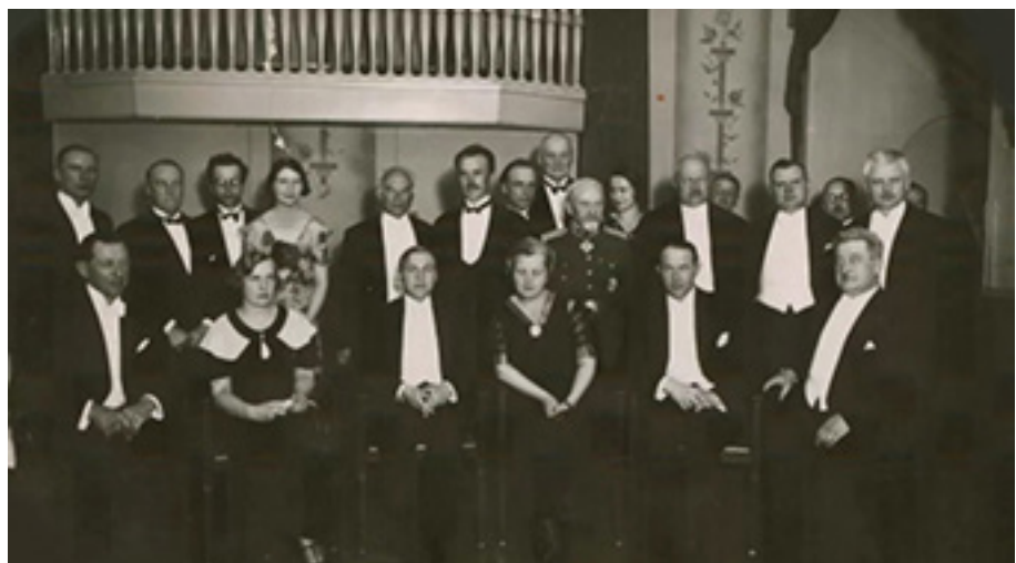
Sofija Čiurlionienė-Kymantaitė (sėdi centre) apie 1934 m. kartu su kitais Tautų Sąjungos atstovo priėmimo dalyviais.

vykusiuose Tautų Sąjungos posėdžiuose, dirbo šios sąjungos Socialinės globos komisijoje. Mokėdama lietuvių, lenkų, rusų, prancūzų ir vokiečių kalbas, būdama intelektualė ir visuomeniška Sofija puikiai atlikdavo savo pareigas. Ji buvo ir aktyvi moterų tarptautinio judėjimo narė, dalyvaudavo tarptautiniuose moterų suvažiavimuose. 1932 m. Sofijai buvo suteiktas Neolithuanų