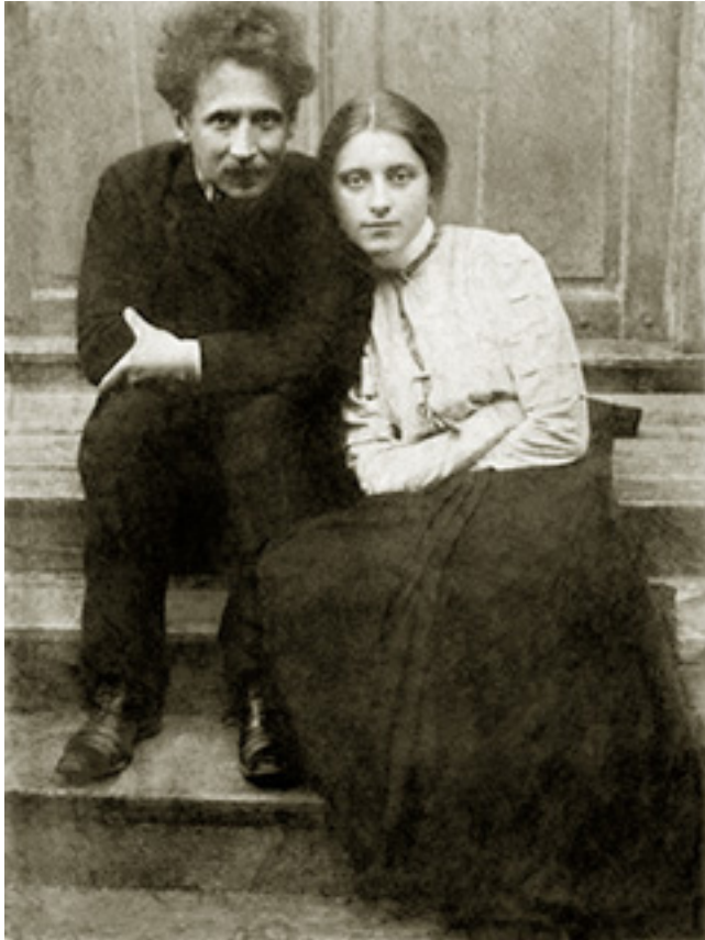
Sofija ir Mikalojus Konstantinas Čiurlioniai apie 1909 m.

kt. klausimais, parengė spaudai lietuvių literatūros vadovėlių ciklą, straipsnių rinkinį „Iš mūsų literatūros“ (išleistas 1913 m.). Tais metais Vilniuje buvo išspausdinta ir jos žemaitiškai parašytų apsakymų knygelė „Pasipasakojima“.