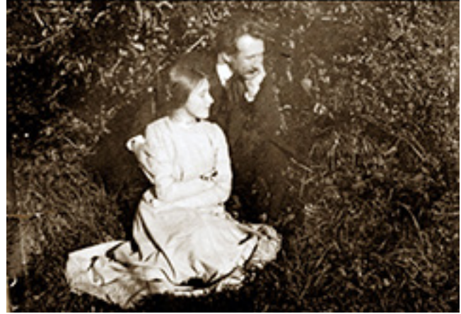
Sofija ir Mikalojus Konstantinas Čiurlioniai apie 1909 m.

1918-aisiais, pasibaigus karui, Sofija su dukrele grįžo į Lietuvą. Pasisvečiavusi pas tuo metu Vieکشniuose (Akmenės r.) gyvenusius tėvus, ji išvyko į Vilnių ir įsikūrė ten, tačiau ilgai čia neužsibuvo. 1919 m., kai Vilnių užėmė Lenkijos kariuomenė, ji persikėlė į Kauną, ten įsidarbino Kauno apsaugos ministerijos Švietimo skyriuje. Papildomai