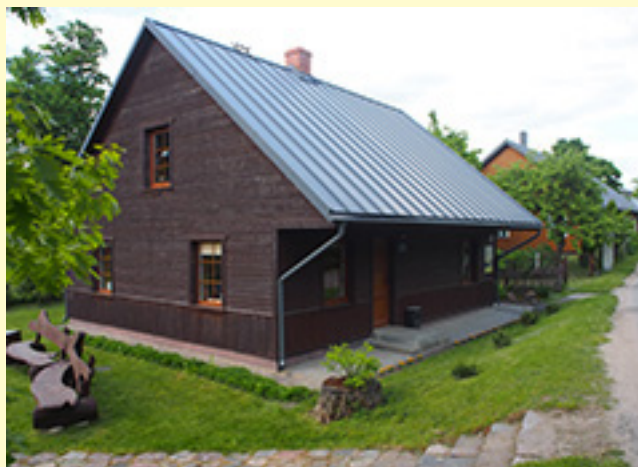
Žemaičių Kalvarijos Alsėdžių gatvės namas Nr. 4, kuriame veikia Vytauto Mačernio muziejus