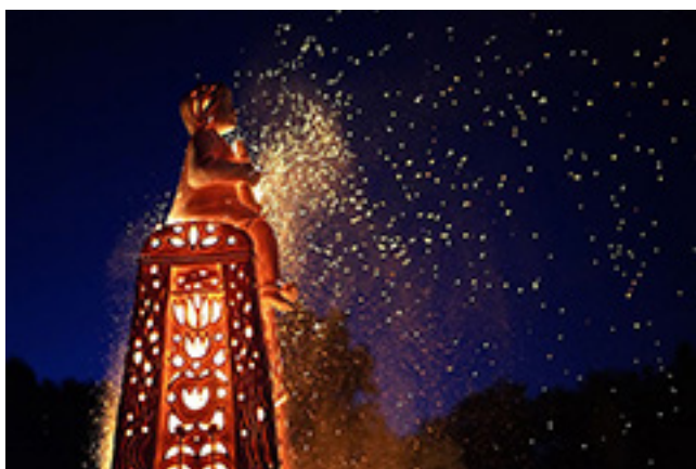
Akimirkos iš plenero uždarymo renginio

Plenere „Užventis MENE XIII. 2022“ kūrė menininkai: