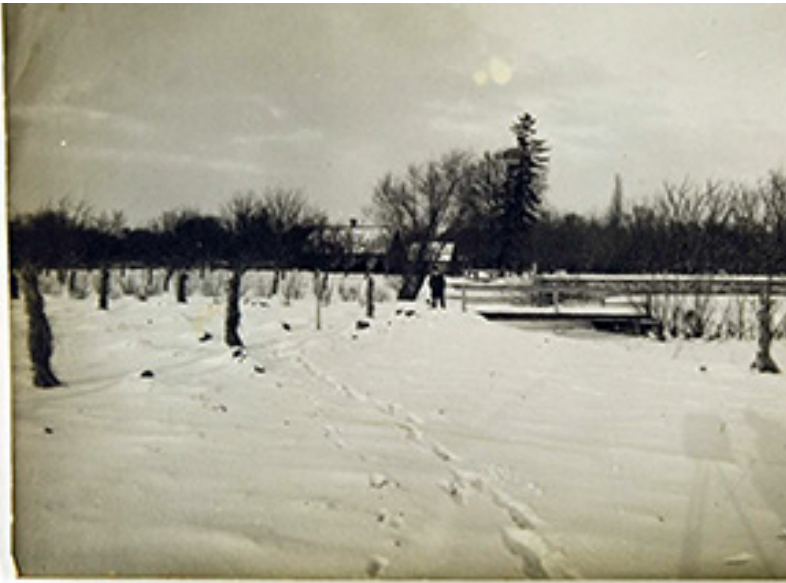
Kosakovskių šeimos archyvas. 7: Ikonografija. - 1790-[1919]. 1769: [Baltijos jūros ties Palanga, gyvenamojo namo, gamtos vaizdų nuotraukos] / fotogr. Paulina Mongirdaitė ir kt. LNMMB. Šaltinis: epaveldas.lt

Kosakovskių fondo nuotrauka nr. 5 itin įdomi tuo, kad joje užfiksuotas ir fotografės bei ant trikojo stovinčio fotoaparato šešėlis.