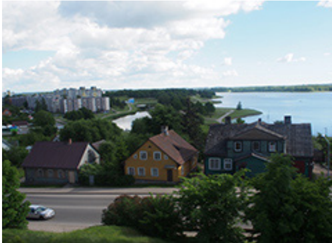
Telšiai. Masčio ežero pakrantė 2022 m.