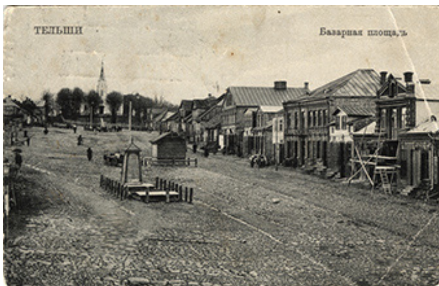
Telšiai. Turgaus aikštė XX a. pradžioje.