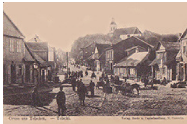
Telšiai, Respublikos gatvė XX a. pirmaisiais dešimtmečiais.