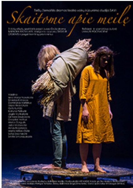
Sigos Gailiuvienės nuotraukose – scenos iš Telšių Žemaitės dramos teatre pastatyto vaikų ir jaunimo grupės SAVI spektaklio „Skaitome apie meilę“