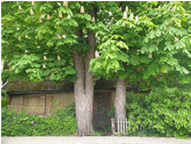
Borumų kalvė ir troba Kretingoje 2022 m.

Tikėjosi, kad po dvejų metų jau galės grįžti į Lietuvą. 1948 m. lapkričio 16 d. iš Italijos Genujos uosto laivu „Protea“ jis išvyko į Australiją – Melburno uostą. 1948 m. gruodžio 22 d. pasiekė Melburną. 1949 m. vasario mėn. jis buvo išsiųstas į šalies sostinę Kanberą. Ten buvusiam karjere jis turėjo skaldyti uolas