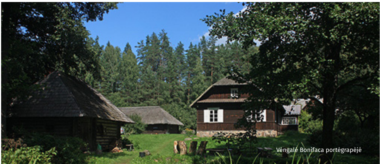
Vėngalė Bonifaca portėgrapėjė

Sava vuožuojėmus partraukės Jūzaps nočjė i truo-ba, pasėjiemė piningū, terbalė ēr pasoka i krautovė.