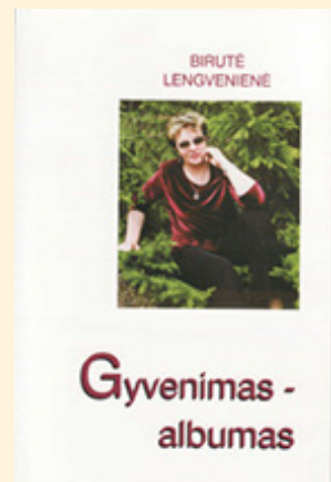
Birutės Teresės Lengvenienės (Toleikytės) knygų viršeliai