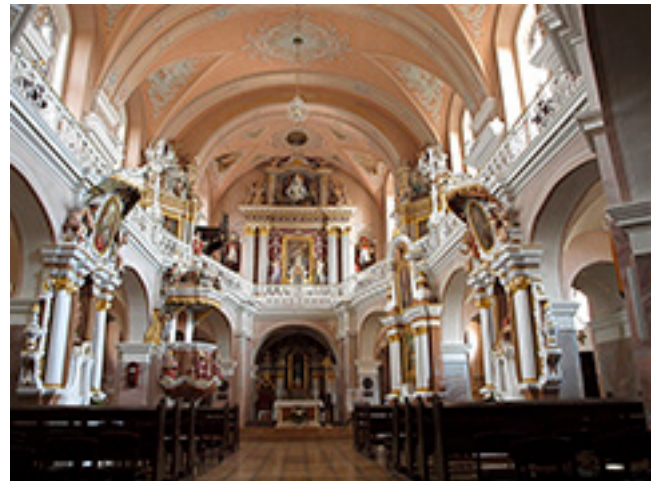
Telšių Katedros aikštės fragmentas ir Telšių šv. Antano Paduviečio katedros interjeras.