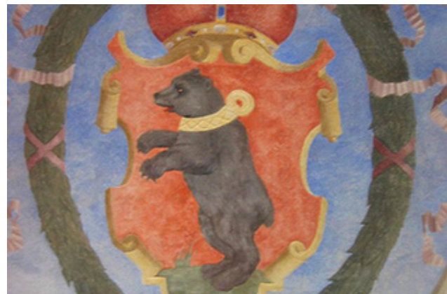
Žemaitijos kunigaikštystės herbo fragmentas