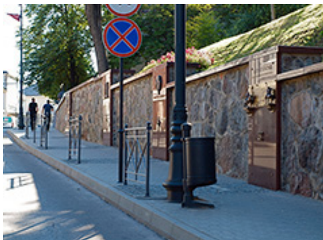
„Žemaičių sienos“ (Telšiai, Respublikos g.) fragmentas