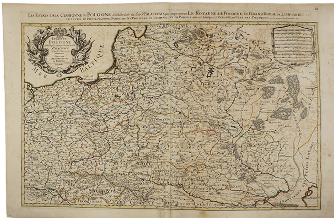
1692 m. išleistas Abiejų Tautų Respublikos žemėlapis, kuriame yra nurodytos jai priklausančios teritorijos: Lenkijos karalystė, Lietuvos Didžiosios Kunigaikštystės, Prūsijos, Mazovijos, Žemaitijos kunigaikštystės, Volynės gubernijos ir Podolės, kuriai priklauso Ukraina. Viršuje – šio žemėlapių fragmentas, kuriame nurodytos Žemaitijos (Samogitia) ribos