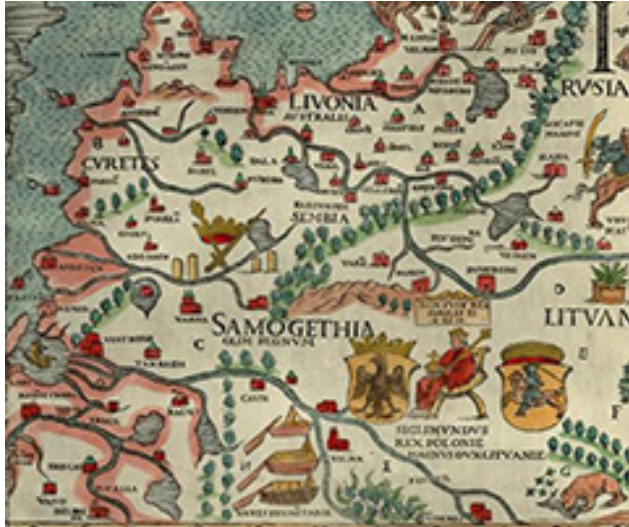
Olaus Magnus 1539 m. žemėlapis („Carta marina et Descriptio septentrionalium terrarum ac mirabilium rerum in eis contentarum, diligentissime elaborata Anno Domini 1539 Veneciis liberalitate Reverendissimi Domini Ieronimi Quirini“) fragmentas