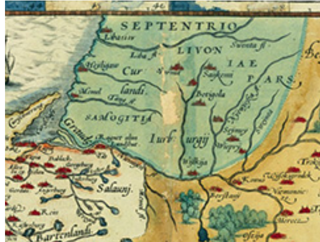
Vazlavo Grodeckio 1570 m. Lietuvos ir Lenkijos žemėlapis fragmentas