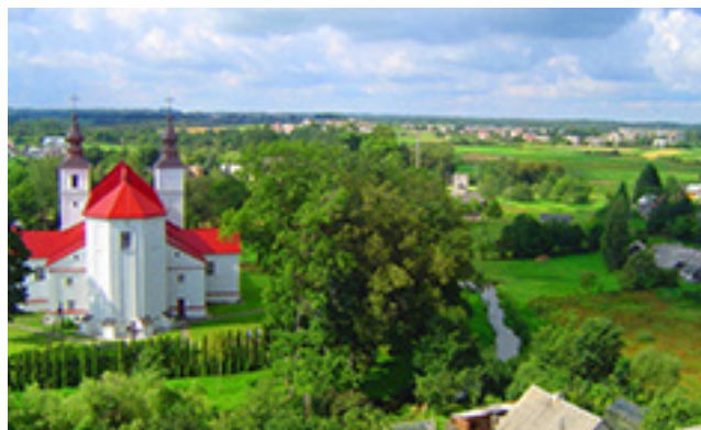
Varnių miestelio panoramos fragmentas

– Bendraujame ir bendradarbiaujame su visomis trimis savivaldybėmis. Veiklos labai įvairios, tarp jų ir dalyvavimas pasitarimuose, veiklų aptari-