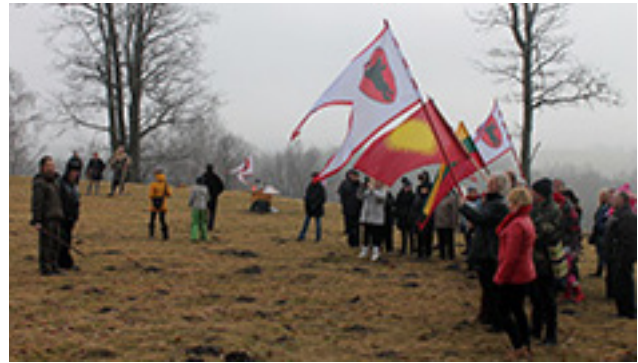
Pilėnų didvyrių atminimo paminėjimas ant Bilionių piliakalnio