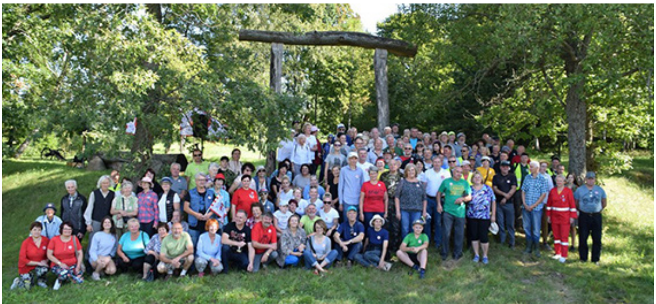
Ant Vembūtų piliakalnio (spėjamoje Žemaičių kunigaikščio Vykinto miesto teritorijoje) Žemaitijos metais vykusios Didžiosios žemaičių talkos dalyviai

Pradėjus veikti direkcijai, kelerius pirmuosius