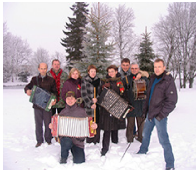
Varnių regioninio parko kolektyvas apie 2011-uosius metus