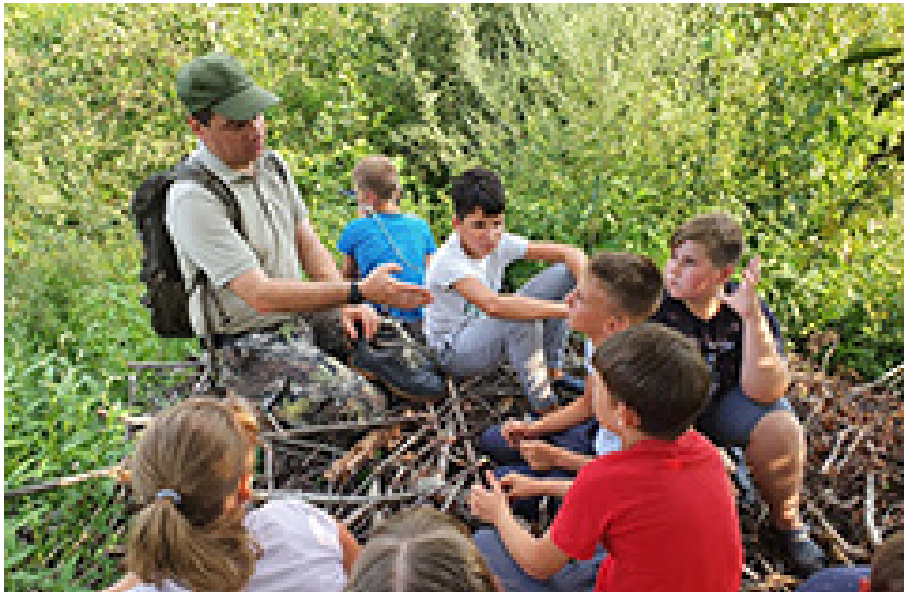
Nuotraukose – Žemaičių kalbos pamoka Varnių regioninio parko direkcijoje ir gamtos edukacijos užsiėmimas Varnių regioniniame parke

Kelmės rajono savivaldybės administracija padėjo suformuoti žemės sklypus, kurie buvo reikalingi, kad galėtume pritaikyti lankymui Pavaninės alkakalnį-Sklepkalnį, Užvenčio seniūnas rūpinasi poilsiavietės prie Gludo ežero tvarkymu, kiek įmanoma prižiūri buvusią Sakelių dvarvietę.