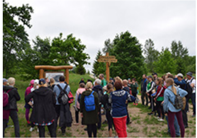
Dviračių žygio dalyviai prie Sklepkalnio (Pavandenės apylinkės) ir žygio į Vembutų (spėjamo Žemaičių kunigaikščio Vykinto miesto teritorija) piliakalnį dalyviai

buvo tik 16 tūkst. hektarų. Pirmaisiais direkcijos veiklos metais ji neturėjo patalpų. Kelis mėnesius man priklausančiu butu, telefonu naudojomės kaip darbovietės. Vėliau direkcijai buvo skirtas vienas kambariukas Varnių seniūnijos pastate. Palaipsniui ėmė formuotis direkcijos kolektyvas – pradėjo dirbti buhalterė, darbininkas, ėjęs ir vairuotojo pareigas, geografą, kultūrologą, ekologą. Mūsų kolektyvas nedidelis – jame dirba tik nuo 7 iki 9 žmonių (turime tik tiek etatų). Iš pradžių mes visi mokėmės dirbti: važiuojome pasisemti žinių pas kaimynus į Žemaitijos nacionalinį parką, vieni su kitais bendravome, vienas kitam padėjome, gilinojome į parko ir direkcijos nuostatus, aiškinomės, ko-