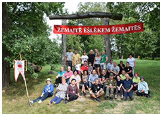
Nuotraukose: (nuo viršaus) žemaičiai ant Šatrijos kalno per Jonines (Rasos šventę); rudens Lygjadienio paminėjimo renginio, vykusio ant Sprūdės piliakalnio, akimirka; vaikai prie Varnių miestelio riboženklio, grupė 2020 m. ant Vebūtų piliakalnio (spėjamo Žemaičių kunigaikščio Vykinto miesto teritorijoje) vykusios žemaičių talkos dalyvių

šlapynėse planavimas ir praktinių atkūrimo priemonių taikymas“ pavyko paruošti Biržulio ežero atkūrimo veiksmų planą, patvenkti Degėsių pelkę, kad būtų galima atstatyti vykdant melioracijos darbus pažeistą buvusio durpyno vandens pusiausvyrą Stervo gamtiniame rezervate ir Debesnų pelkėje sureguliuoti gamtotvarkos veiklas, kurias vykdo ūkininkų šeima, ganydama Herefordų veislės galvijus ir šienaudama.