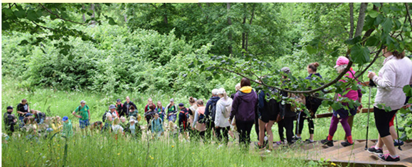
Žygis į Vembūtų piliakalnį (spėjama Žemaičių kunigaikščio Vykinto miesta)