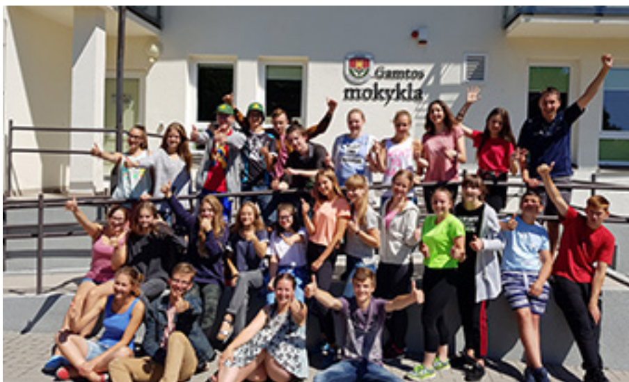
Grupė Gamtos mokyklos moksleivių prie Varnių regioninio parko direkcijos Gamtos mokyklos

šežerio pažintiniame take, nes jo atnaujinimui nuolat lėšų skiria Šilalės rajono savivaldybės administracija.