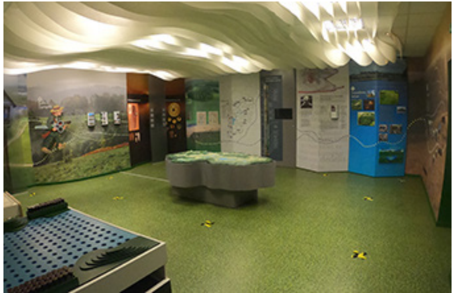
Interaktyvus muziejaus ekspozicija Varnių regioninio parko direkcijoje

organizuojamuose žygiuose pėsčiomis ir dviračiais, užsisakyti įvairias edukacijas, organizuojant stovyklas pasirinkti mūsų parko Gamtos mokyklą. Labiausiai lankomi Pašatrijos (Šatrijos), Sprūdės, Medvėgalio, Bilionių piliakalniai ir Sietuvos kūrgrinda. Tikimės, kad šiemet sėkmingai pavyks atnaujinti Jomantų miško pažintinį taką. Paukščių stebėtojų laukia naujai pastatytas paukščių stebėjimo bokštelis prie Biržulio ežero.