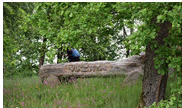
Spėjamo Žemaičių kunigaikščio Vykinto miesto rodyklė