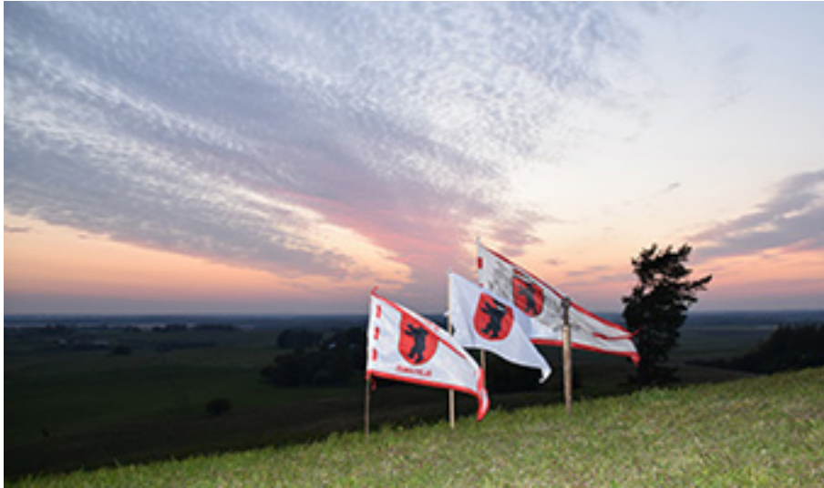
Rudens lygiadienis ant Žemaitijos kalvų