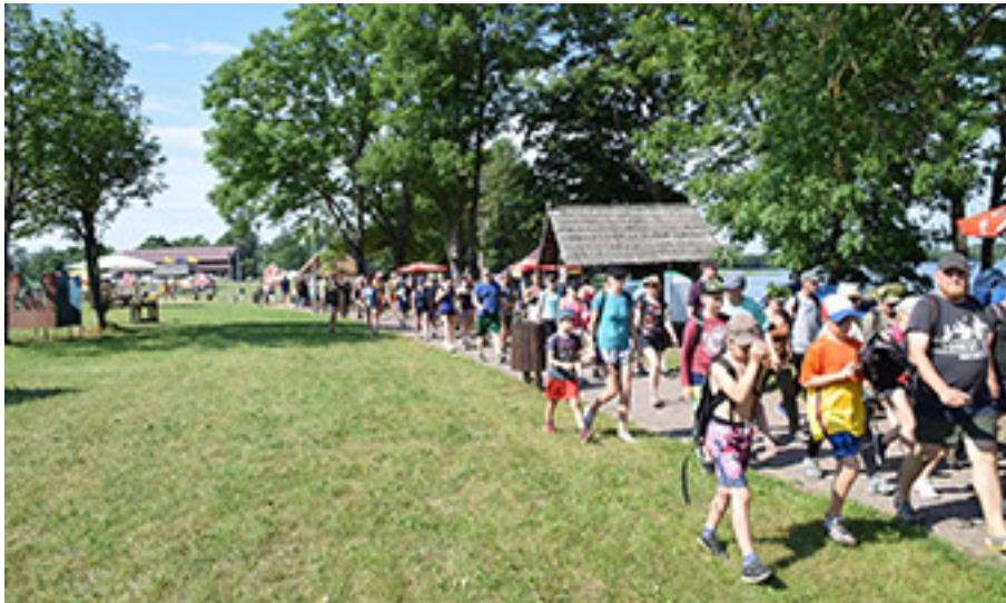
Žygis aplink Paršežerį