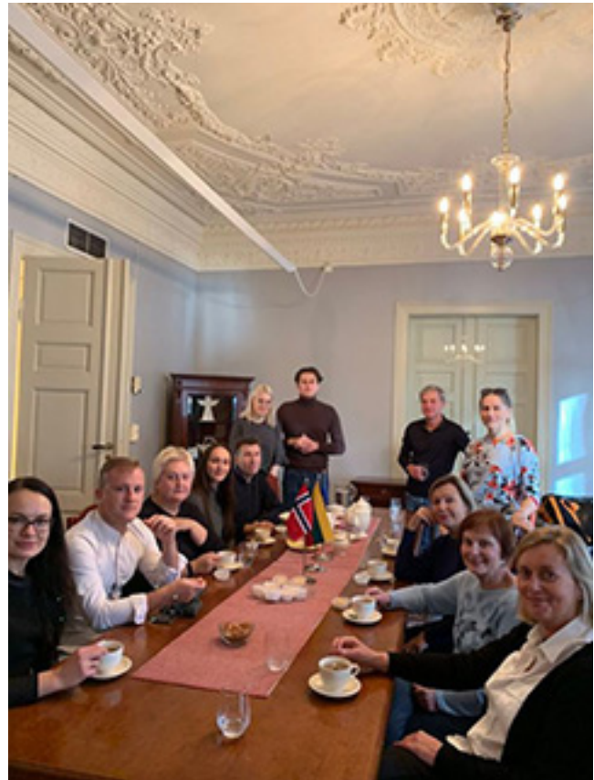
Palangos „Grubiojo“ teatro trupė Lietuvos ambasadoje Osle (Norvegija)

Palangos „Grubijame“ teatre vaidina įvairaus amžiaus aktoriai. Kolektyvas nuolat dalyvauja Lietuvos mėgėjų teatrų šventėse-apžiūrose „Atspindžiai“, Tarptautinės teatro dienos (švenčiama kasmet kovo 27 d.) proga rengiamose šventėse „Tegyvuoja teatras“, pats į šiai dienai skirtus renginius pakviečia žiūrovus. Šiomet ta proga jis parengė specialią programą, tad kovo mėnesį Kurhauzo Teatro salėje žiūrovai turėjo galimybę pasižiūrėti net keletą spektaklių. Vieną jų (komišką dramą „Tik suaugusiems“) rodė ir šventės išvakarėse į kurortą atvykę „Grubiojo“ bičiuliai iš Oslo (Norvegija) – ten veikiantis Lietuvių mėgėjų teatras. Su jais teatras paminėjo ir Tarptautinę teatro dieną, susitiko su miesto vadovais, kartu su jais įsiamžino nuotraukoje. Na o anksčiau, 2019 m., minint pasaulio lietuvių bendruomenės metus, Palangos „Grubusis“ teatras Norvegijos lietuvių bendruomenės kvietimu