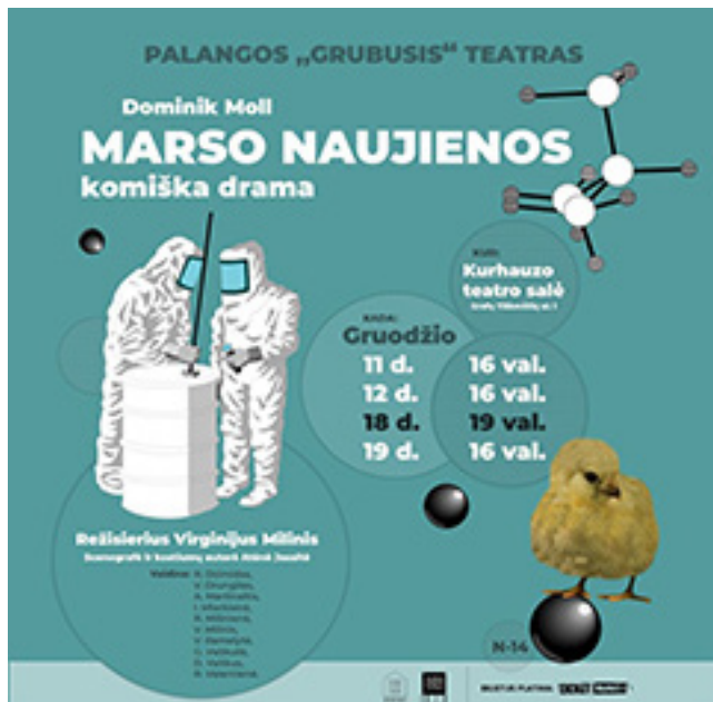
Palangos „Grubiojo“ teatro paskutiniiais metais pastatytų spektaklių plakatai

šiuos savo darbus. 2001-aisiais „Grubusis“ buvo pripažintas geriausiu metų mėgėjų teatru Lietuvoje ir į Palangą parvežė „Aukso paukštę“.