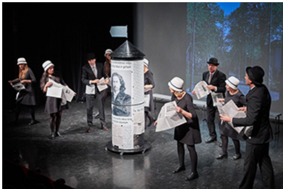
Scenos iš Palangos „Grubiojo“ teatro pasirodymo Palangos kurhauzo medinės dalies atidarymui skirtoje šventėje 2020 m. spalio 17 d.