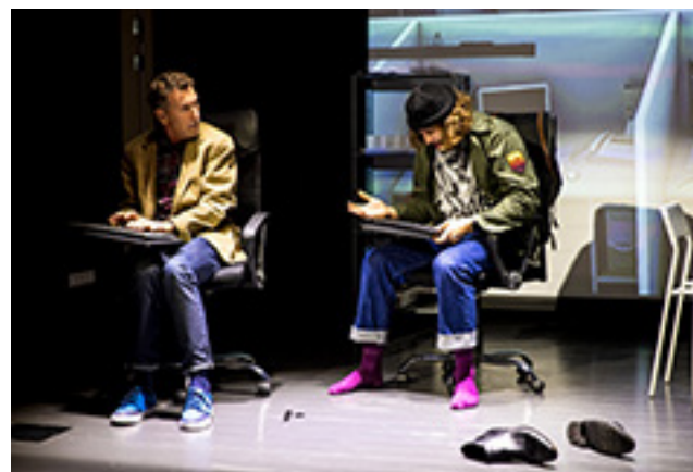
Iš kairės: scenos iš spektaklių: „Tanato viešbutis“, „Marso naujienos“ (abiejų rež. V. Milinis).