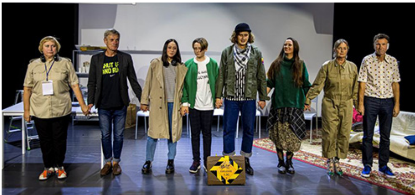
Scenos iš spektaklio „Marso naujienos“ (rež. V. Milinis) ir šiame spektaklyje vaidinę aktriai.