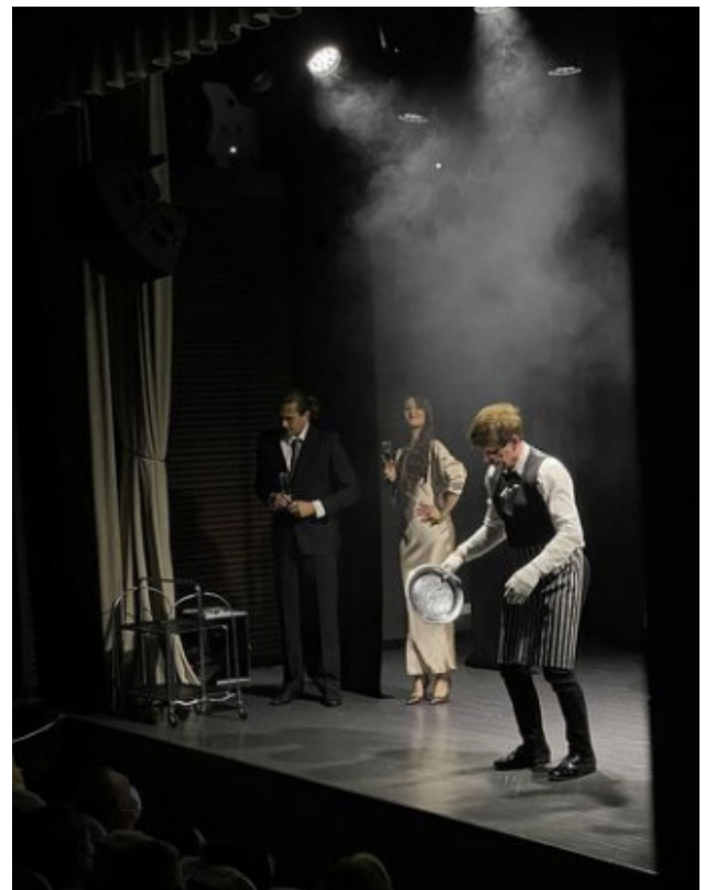
Scenos iš Palangos „Grubiojo teatro spektaklio „Tanato viešbutis“ (rež. V. Milinis), pastatyto pagal A. Morua novelę.