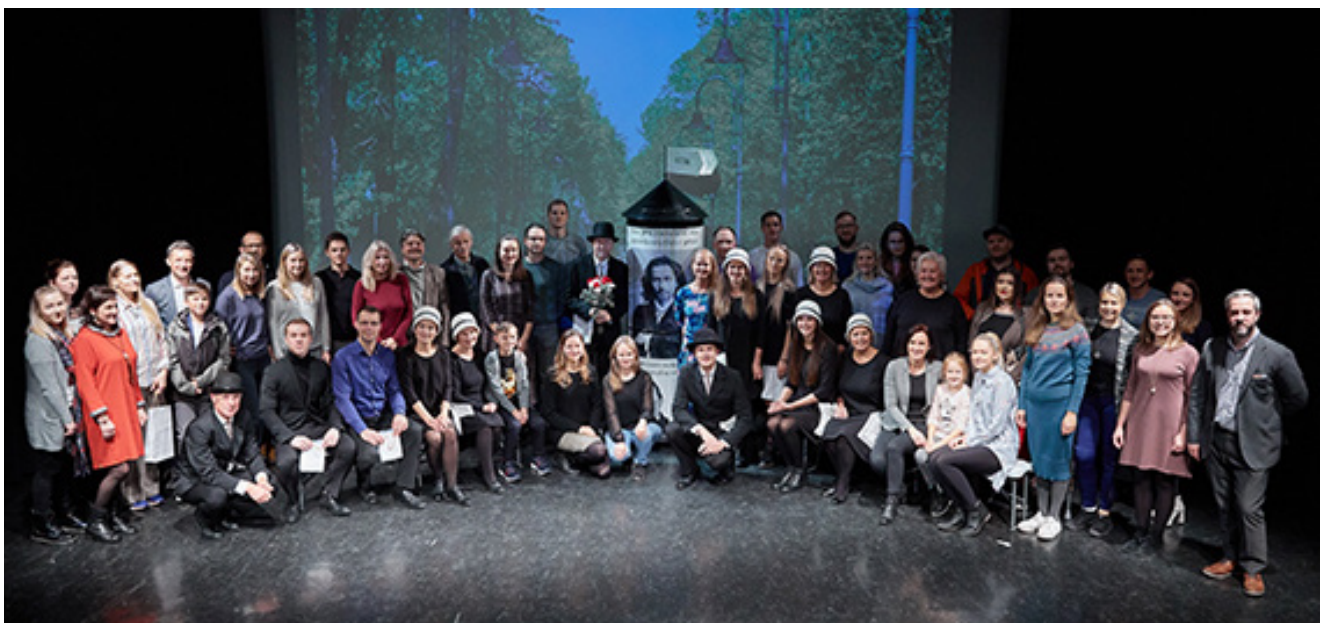
Palangos „Grubiojo“ teatro kūrybinės grupės ir jų bičiulių nuotrauka po palangiškų spektaklio „Laikykis, Vydūne!“, parodyto 2019 m. gastrolių Novegijoje metu.