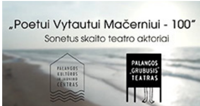
2021 m. Palangos „Grubiojo“ teatro sukurtu videoklipe, skirtu poeto Vytauto Mačernio 100-osioms gimimo metinėms, reklaminis plakatas