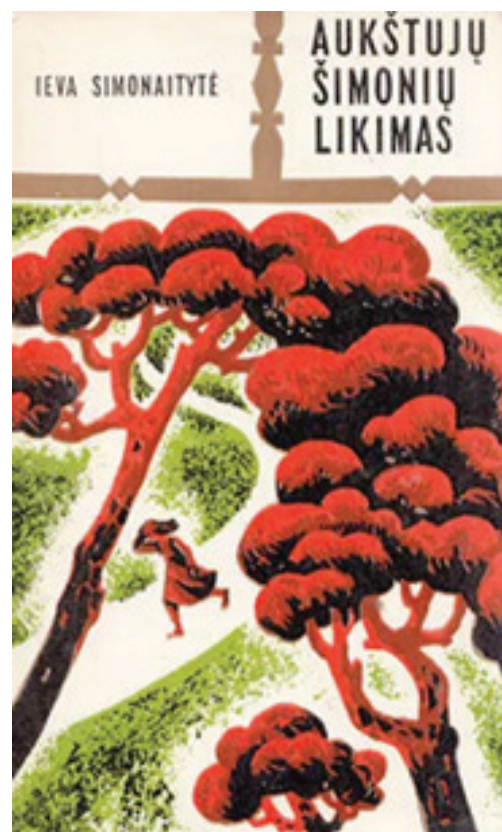
Knygos „Aukštųjų Šimonių likimas“ (1976 m., leidėja „Vaga“) viršelis