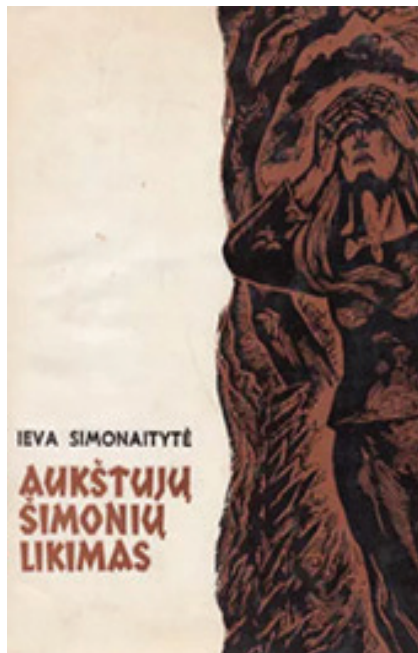
Knygos „Aukštųjų Šimonių likimas“ (1984 m., leidėja „Vaga“) viršelis

ir 1990 m. Čikagoje išleistas Jono Užpurvio (1891–1992) veikalas „Trys kalbinės studijos“. [...]