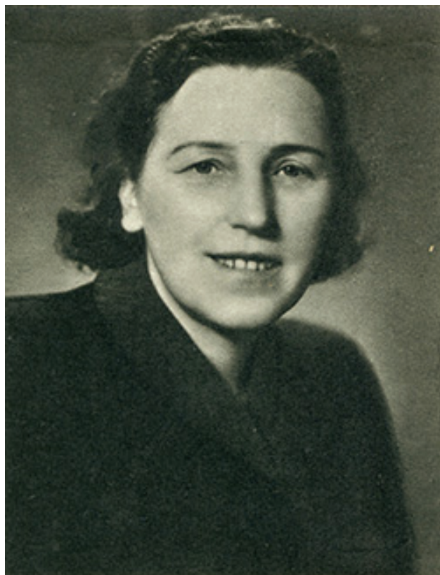
Ieva Simonaitytė. 1950 m.