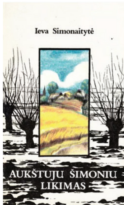
Knygos „Aukštųjų Šimonių likimas“ (1986 m., leidėja „Šviesa“) viršelis