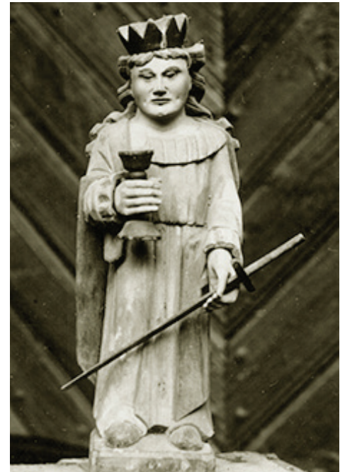
Mečislovo Sakalausko nuotraukoje – Nemakščių šv. Barbaros skulptūra. Autorius nežinomas. Fotografuota 1966 m.

• 1915 m. vykstant karui vokiečiai apšaudė Ne-