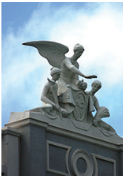
Bonifaco Vengalio nuotraukoje – Plungės kunigaikščių Oginskių dvaro centrinių rūmų fasado fragmentas (skulptūros)

moksleivių. Dažnai mokslo įstaigos, vykdydamos projektus, pačios inicijuoja įvairius darbus, Plungės parko tvarkymo akcijas. Moksleiviai muziejuje renka ir tyrinėja medžiagą įvairiomis mokytojų skirtomis temomis, taip pat mielai ištraukia į muziejinių vykdomų projektų veiklas – padeda juos parengti ir įgyvendinti. Vienas jų buvo skirtas Plungės žydų istoriai ir kultūrai pažinti, Plungės tarpukario kultūrinėms tradicijoms pažinti, istorinės rekonstrukcijos akcijos dvaro istorijos tema ir daugelis kitų. Šioje srityje daug metų muziejus bendradarbiauja su Plungės „Saulės“ gimnazijos tolerancijos centru, Plungės Senamiesčio pagrindine mokykla, Plungės Oginskio meno mokykla, Plungės technologijų ir verslo mokykla, kitomis Plungės mokyklomis, taip pat Šateikių pagrindinės mokyklos, Salantų gimnazijos mokytojais ir moksleiviais.