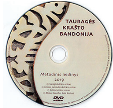
Kompaktinė plokštelė „Tauragės krašto bandonija“. Dizaineris Marius Girutis

Lietuvos nacionalinis kultūros centras savo administruojamame Nematerialaus kultūros paveldo sąvade nurodo, jog „Manoma, kad vokiečių sukonstruota koncertina ir jos atmaina bandonija į Lietuvą per Rytų Prūsijai priklausiusią Mažąją Lietuvą atkeliavo XIX a. viduryje ir pirmiausia paplito