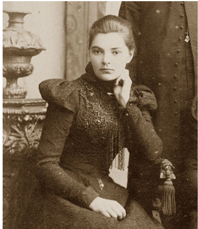
Marija Pečkauskaitė-Šatrijos Ragana jaunystėje.