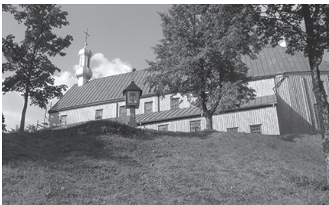
Alsėdžių Švč. Mergelės Marijos Nekaltojo Prasidėjimo bažnyčia ir pamaldos joje.