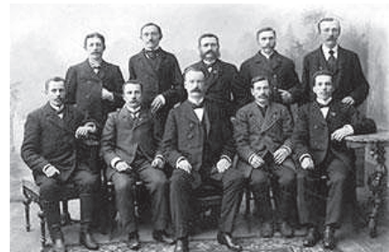
Alsėdžių atstovai Vilniaus Seime (1905 m.). Centre – Vasario 16-osios akto (1918 m.) signataras Stanislovas Narutavičius.

Alsėdžiuose veikia Stanislovo Narutavičiaus gimnazija (1951–2015 m. – vidurinė mokykla, nuo 2015 m. – gimnazija), savo istoriją nuo 1948 m. skaičiuojantys kultūros namai (Žemaičių Kalvarijos kultūros centro filialas), turtinga biblioteka (veikia nuo