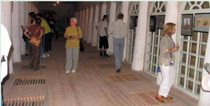
Laikinoji kunigaikščių Oginskių giminės istorijos ekspozicija restauruojamuose Zalesės kunigaikščių Oginskių rūmuose. 2005 m.