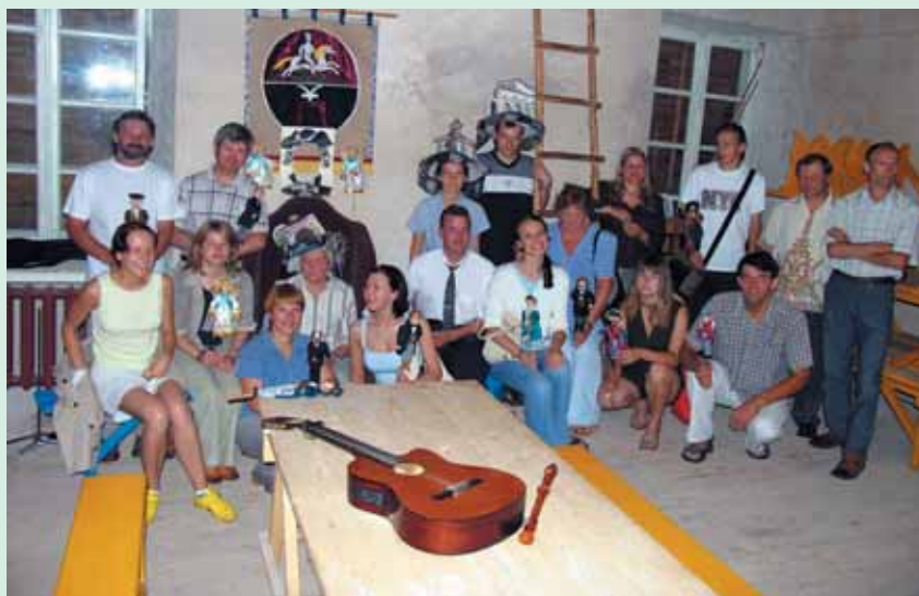
2005 m. ekspedicijos dalyviai Zalesės Mykolo Kleopo Oginskio muziejuje