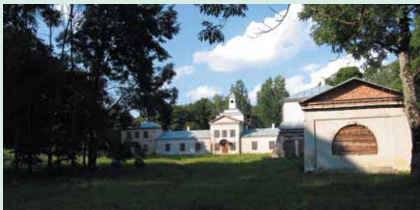
Restauruojami Zalesės dvaro centriniai rūmai. 2005 m.