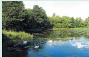
Iš kairės: koncertas kuriamame Zalesės Mykolo Kleopo Oginskio muziejuje; senoji Zalesės dvaro parko alėja; Zalesės Oginskių dvarvietės tvenkinio fragmentas