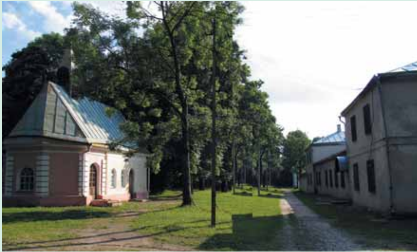
Oginskių dvarvietė Zalesėje (kairėje – koplyčia, dešinėje – restauruojamų centrinių rūmų fragmentas)

lines kūrybinių partijas. Zalesėje rinkdavosi vienminčiai ir draugai, su kuriais būdavo aptariamoms politinės ir visuomeninės naujienos, vykdavo naujų muzikinių ir teatrinių kūrybinių perklasos.