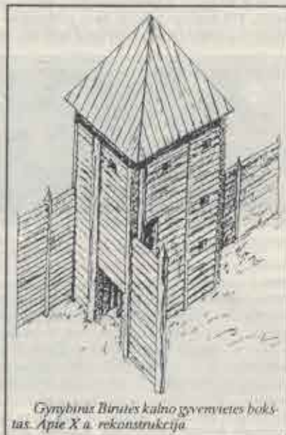
Gynybinis Birutės kalno gyvenvietės bokštas. Apie X a. rekonstrukcija.

Guntinėje santvarkoje įvairios žmogaus dvasinės veiklos sritys — menas, pasaulėjauta, filosofija — dar tebesudarė vieną visuomenės sąmonės kompleksą, kurį jungė religija. Čia buvo susilieję ir gyvųjų, ir mirusiųjų santykiai, guntos garbinimo bei pažinimo, pasaulio modelio kūrimo ir jo vaizdavimo apeigos, simboliuose arba ornamentikoje, dievų (dažnai skirtingų atskiruose regionuose) garbinimo reiškiniai. Materialinė šios ideologijos išraiška buvo laidojimo papročiai, šventviečių (alkų) įranga, menas.