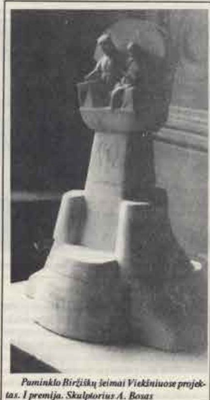
Paminklo Biržiškių žemai Vieksniuose projektas. I premija. Skulptorius A. Bosas

Pokarinius Vieksnius, beje, niokojo ne patys Kremliaus šeiminkai, bet visokiausi tarpininkai. Tokiais buvo sovietmečio projektuotojai gyvenviečių planavimo (urbanistikos) specialistai,