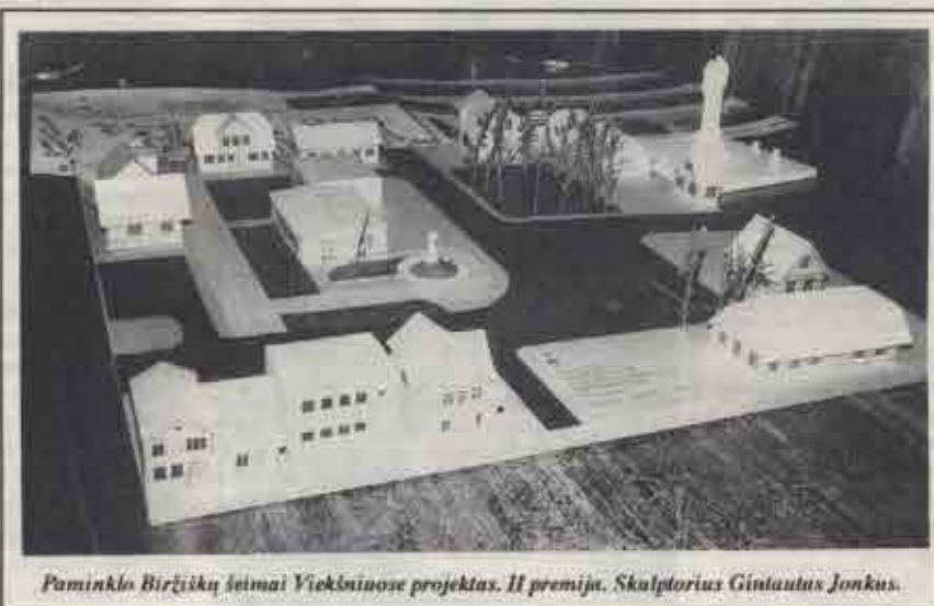
Paminklo Biržiškų šeimai Viekšniuose projektas. II premija. Skulptorius Gintautas Jonkus.

Tad Viekšniuose tebesitęsia pokariu užvirusi painiava. Joje it liūne pražuvo daug per amžių sukurtą vertybių, dabar prarandama galimybės užgydyti senenos praieities žaizdas.