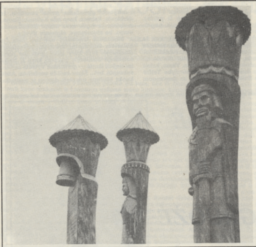
UNT DŽIOGA PĖLEKALNĖ