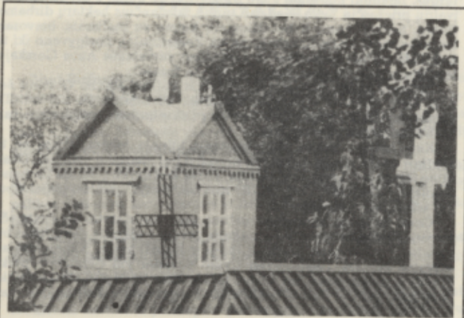
GARBĒS KALNELIO KOPLYČIA

Keliaujantiems i Luokē ar prie garsiojo Šatrijos kalno, derētū pakeliui stabtelēti keletā kartū, pasidomēti ir kitomis šio kampelio gar-senybėmis. Papasakosiu apie vienā iš jū.