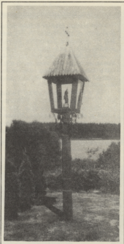
KOPLYTĖLĖ SODYBOJE PRIE ILGIO EŽERO

Žemaitijos nacionalinis parkas — visiems, kas myli gamtą, domisi ja, kas myli Žemaitiją.