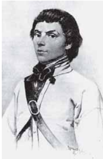
Tadas Kosciuska 1794 m. su sukilėlio uniforma. Portreto autorius nežinomas

nežinotų, M. K. Oginskis paliko beveik visą dalinį Dusetose (Breslaujos žemės), o pats su trimis šimtais kavaleristų patraukė link Dauguvos – prie Dinaburgo. Tačiau čia sukilėlių jau laukė – rinkosi rusų kariuomenė. Po kurio laiko, taip ir nepersikėlęs per upę, dalinys grįžo į Dusetas. Tiesa, 30 savanorių vis dėlto įsibrovė į miestą ir netyčia jį padegė.