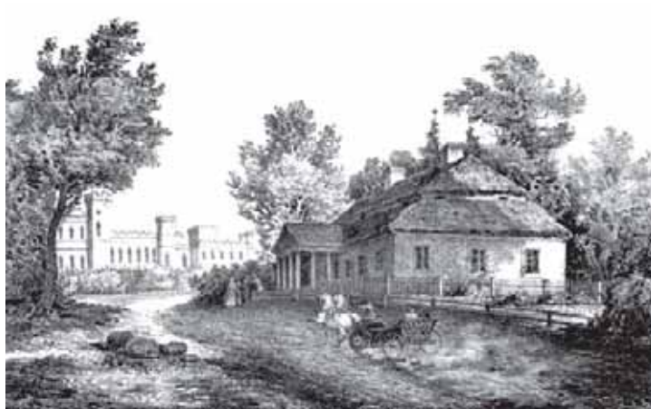
Merečiovčiznos palivarkas prie Kosavos miestelio. Dailininkas nežinomas

roli Kosavos miestelio (dabar – Ivacevičų rajonas Baltarusijoje).