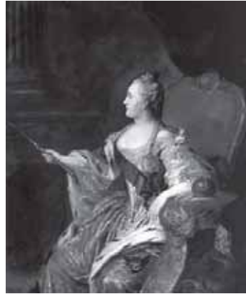
Iš kairės: Rusijos imperatorių Jekaterinos II ir Petro III sūnaus, Rusijos imperatoriaus (1796–1801) Pavolo I Petrovičiaus (1754–1801) portretas. Dailininkas Steponas Ščukinas; Rusijos imperatorienės (1762–1796) Jekaterinos II (1729–1796) portretas. Dailininkas F. S. Rokotovas

ratais, T. Kosciuška atsistatydino. 1792 m. birželio 26 d. Prancūzijos konventas jam, taip pat Dž. Vašingtonui, I. Pestalociui, F. Šileriui ir kai kuriems kitiems asmenims suteikė Prancūzijos garbės piliečių vardus. 1792 m. pabaigoje T. Kosciuška politiniais sumetimais išvyko į Leipcigą.