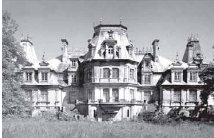
Guzovo dvaro rūmai 2006 m.

damas skaityti... Savo nuolankumu ir maloniu charakteriu jis greitai pelnė mano pasitikėjimą ir švelnų palankumą.“