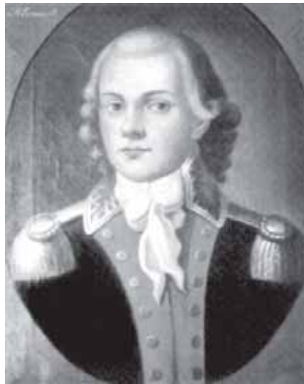
1794 m. sukilėlių antspaudas; Jokūbo Jasinskio (1761– 1794) portretas. Autorius nežinomas.

atakuoti [...]. Susirėmimas [...] užtruko iki pusės dvyliktos, priešas buvo visiškai sutriuškintas ir aš vijausi jį didžiai sumišusį [...] daugiau nei šešis varstus [...]. Priešas buvo priverstas mums palikti visą savo gurguolę iš daugiau nei du šimtus vežimų, kuriuose buvo sukrauta daug grobio iš Ivenčiaus.“