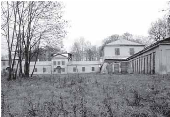
Kunigaikščių Oginskių dvaro sodyba Zalesėje 2006 m.

ciškui Ksaverui (1742–1814). Pranciškus neturėjo vaikų ir Zalesę paliko sūnėnui Mykolui Kleopui Oginskiui, kuris čia su šeima gyveno apie 20 metų. Netrukus kunigaikštį pasiekė žinia, kad jam caras Aleksandras I suteikė Rusijos imperijos senatoriaus pareigas. Zalesėje M. K. Oginskis pradėjo rašyti savo literatūrinius kūrinius – „Laiškus apie muziką“ bei „Atsiminimus apie Lenkiją ir lenkus nuo 1788 iki 1815 metų pabaigos“, kuriuose ne kartą pabrėžė savo kilmę, nurodydamas, kad yra kilęs iš Lietuvos. Zalesėje jis taip pat sukūrė didelę dalį savo romansų ir polonezų. Paplitusi nuomonė, kad būtent čia gimė ir žymusis jo polonezas „Atsisveikinimas su Tėvyne“ (klaidinga manyti, kad tokį pavadinimą sugalvojo pats autorius – tų laikų M. K. Oginskio muzikinių kūrinių leidimuose polonezas vadinosi tiesiog „lia-minor“). Iš kunigaikščio Mykolo amžininkų atsiminimų sužinome, kad jo Zalesės rezidencija tuo metu buvo vadinama „Šiaurės Atėnais“. Dabar Zalesė – miestelis Gardino srityje, netoli Smurgainių, beveik pusiaukelėje važiuojant geležinkeliu iš Vilniaus į Minską. Čia iki mūsų laikų išliko