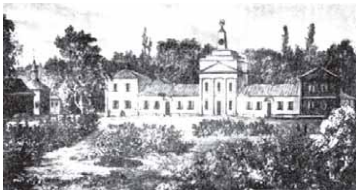
Kunigaikščių Oginskių Zalesės dvaro sodyba XIX a. Napoleono Ordos piešinys