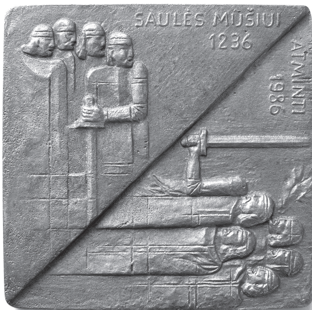
Medalis (vienpusis), skirtas Saulės mūšiu atminti. 1986. Dailininkas Jonas Aliulis. Aliuminis, lietas. 11,8 x 11,8. ŽAM GEK 28336, DM-160