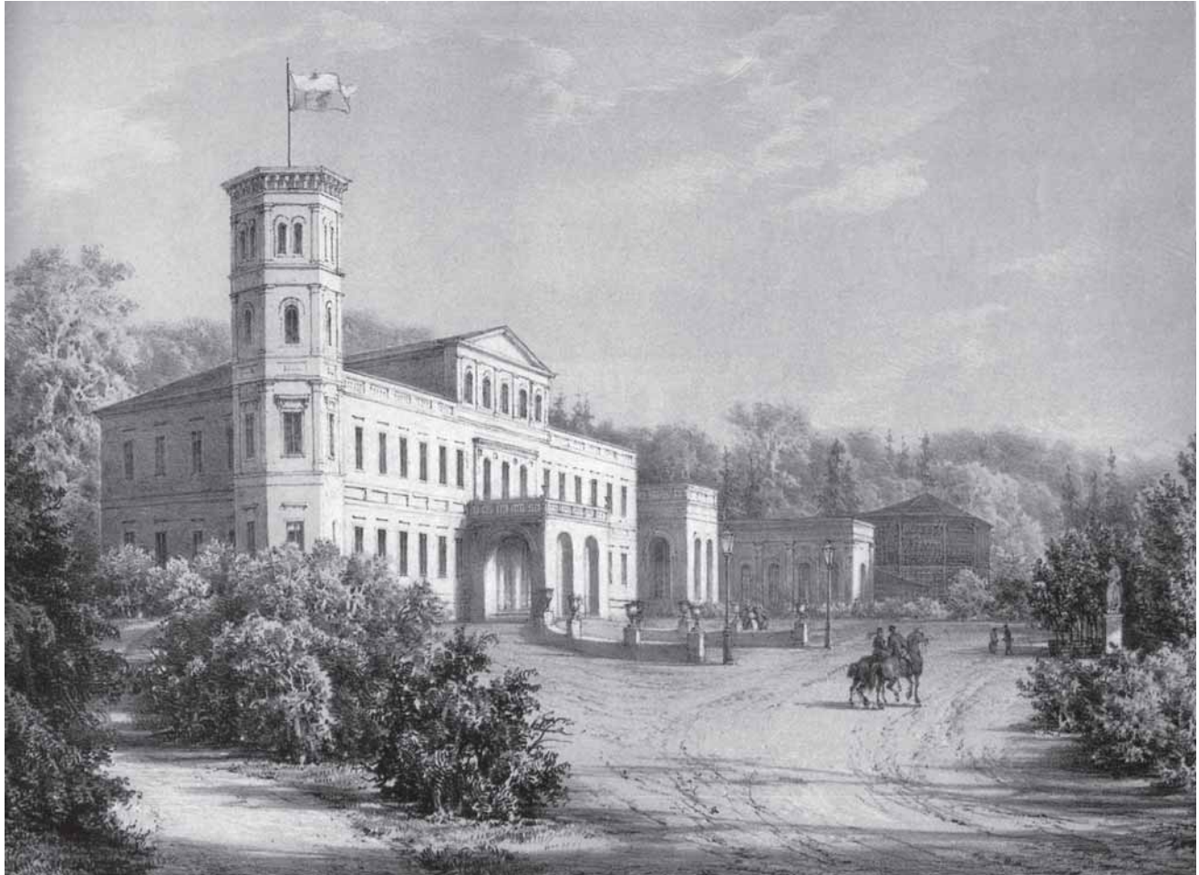
Napoleonas Matas Tadeušas Orda (lenk. Napoleon Mateusz Tadeusz Orda, 1807–1883). Rietavo dvaro sodyba. XIX a. pab.