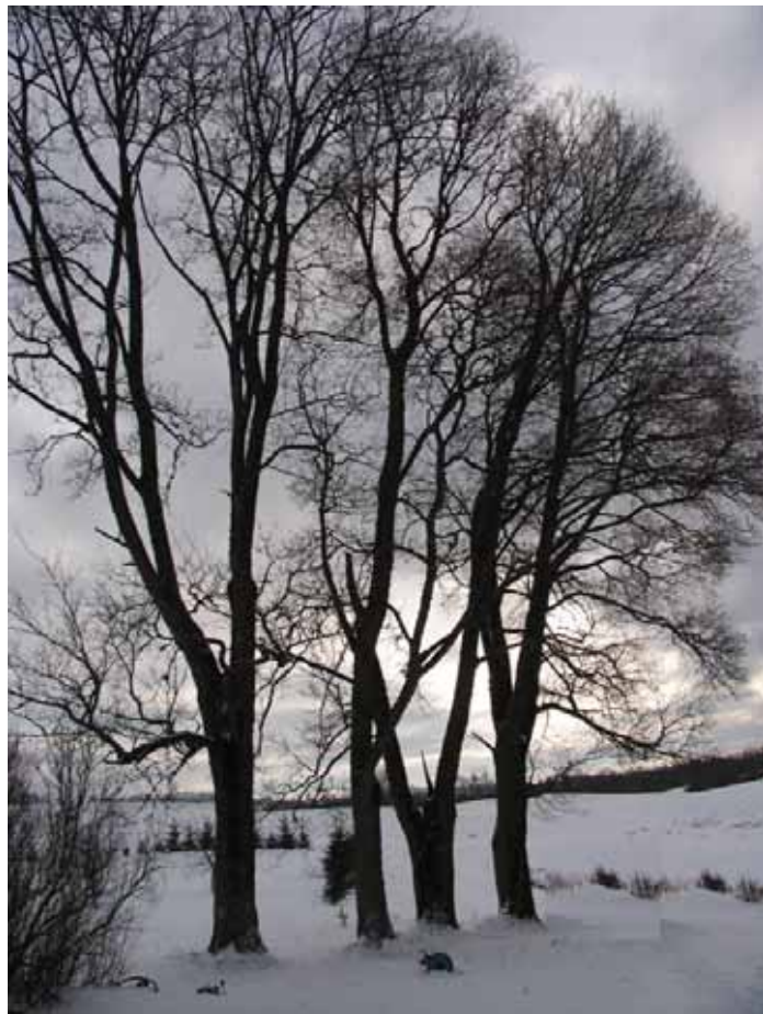
Žiema Žemaičių Kalvarijoje.

Mergaitės, kurios tarnauja kirpyklose Naujųjų Metų vakare išpeša po vieną savo ir sau patinkančio vaikiną plauką ir padeda juos abu ant stalo. Jei vyriškio plaukas pradeda rangytis – už to vyriškio ištekės, o jei