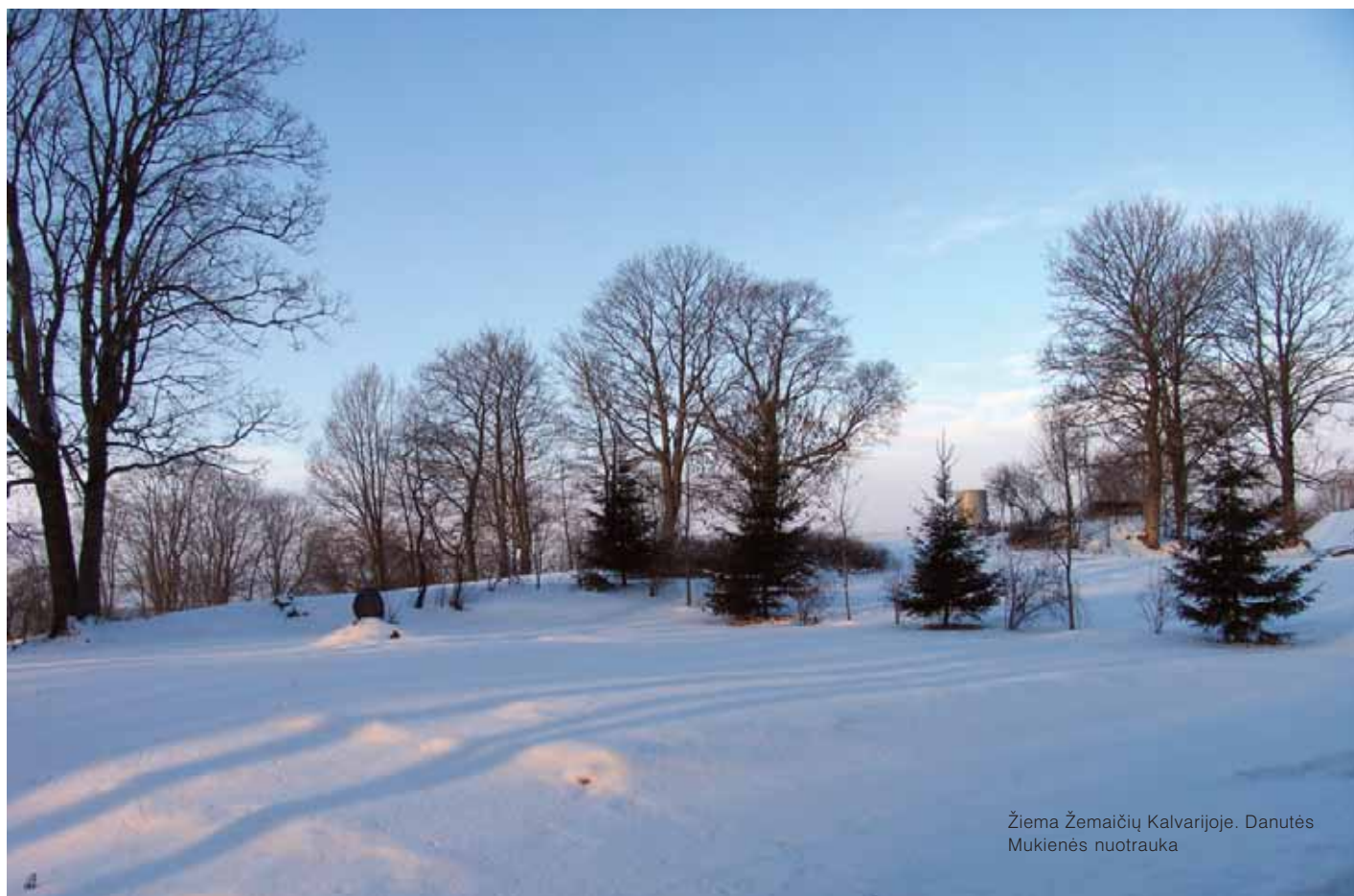
Žiema Žemaičių Kalvarijoje. Danutės Mukienės nuotrauka

Naujųjų Metų išvakarėse vaikinai (merginos) pila kavą ant lėkštės dugno. Jei išsipila karieta ir arklys – turtingas tapsi, jei susikibusios dvi žmogaus figūros –