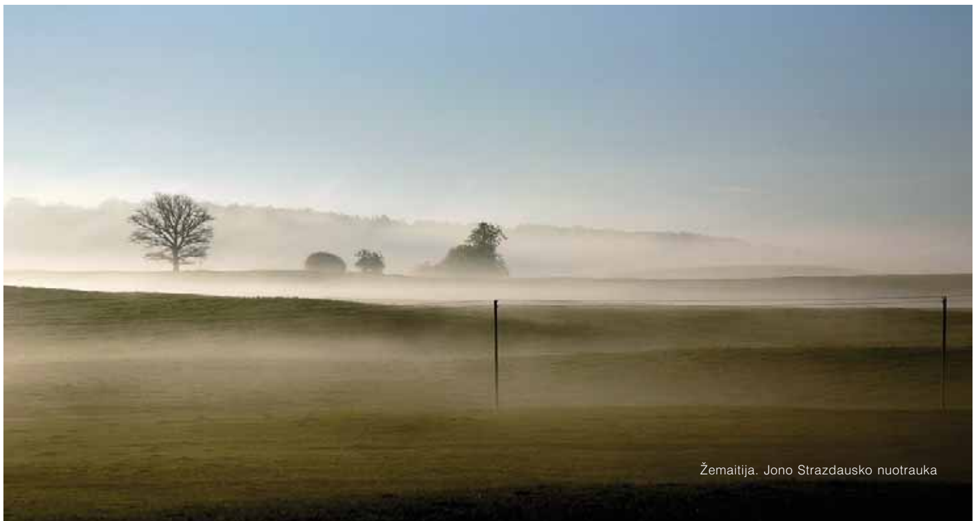
Žemaitija. Jono Strazdausko nuotrauka