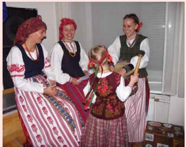
Švėntės šeimuos ratė

Sokėlėms kožna vėina Piršlīs pėrmiausėi prabėla – Kelkitės i(r) apsitaīsikit galvelės. Laiks i bažnīčė važiouti Arklė pakinkītė, kalnouta. Išvažiava dainiuodami Kiti dar i(r) šaudīdami. Suejė į bažnīčė, Varpā suskambėjė Vargonininks spaud didžiau, Vo jaunoji verk griaudžiau. Vo kuo verki, kuo durniouji I(r) jaunouju nedebuojīs.