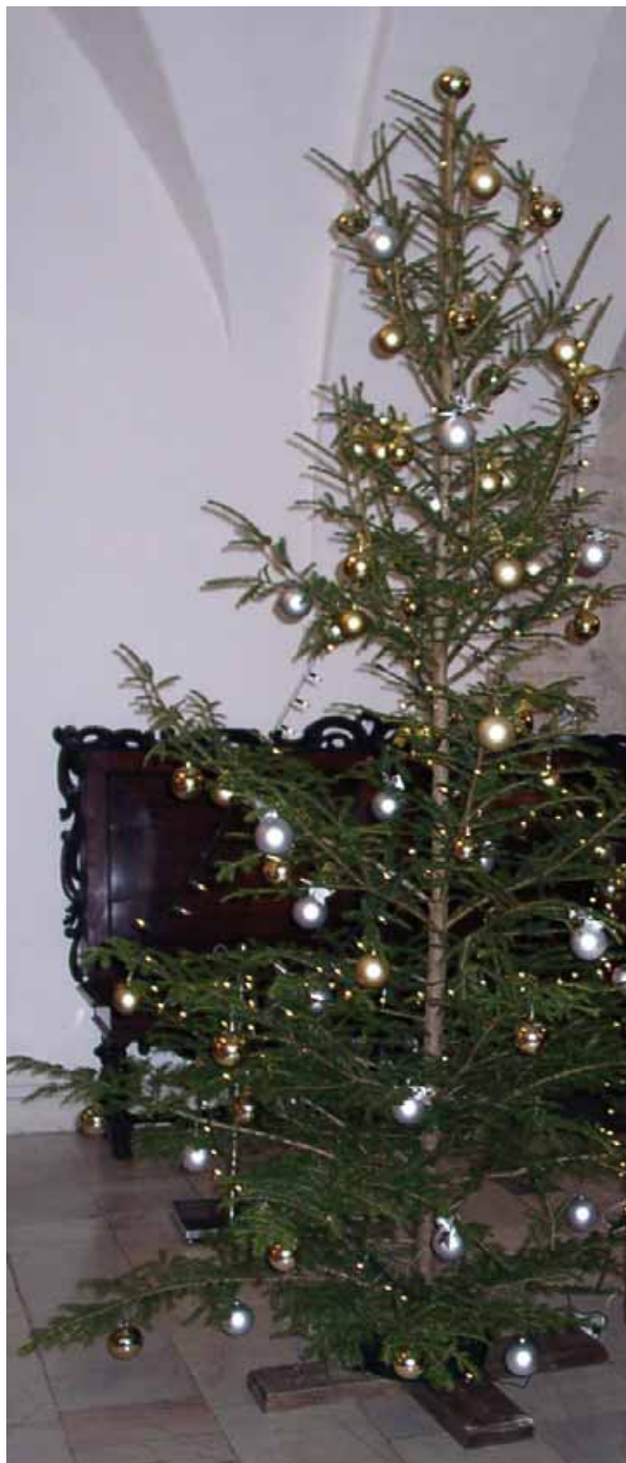
kalėdų eglė. Tokias puošiamame mieste, dažnai ir kaime šiais laikais.