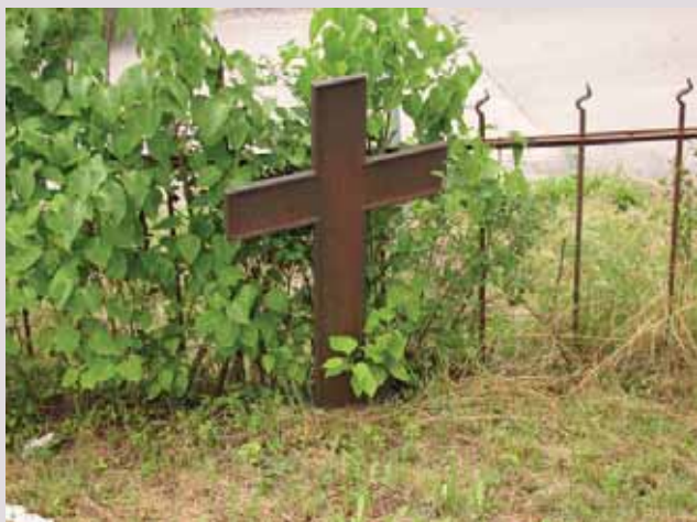
Kapeliai Bajoruose (Kretingos r.).