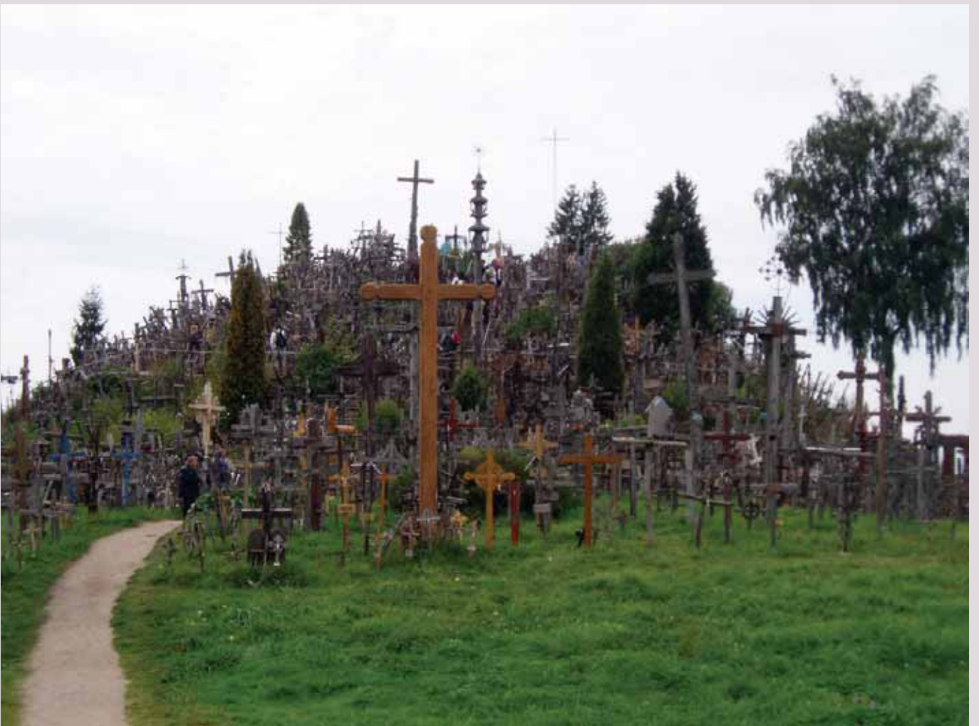
Kryžių kalnas.