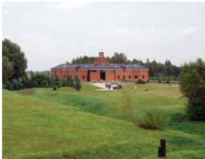
Kryžių kalnas (Šiaulių r.)

Senieji žemaičiai tikėdavo, kad jei kurį šeimos narį, giminaitį ar svetimą žmogus, gyvendamas žemėje, yra labiau mylėjęs, tą labiau myli ir miręs – karščiau už jį