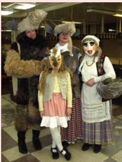
Portėgrapėjuos – folkluora ansamblė „Vilnelė“ parsirėngielė Užgavieniū švėntie.

Ubagū daug pasikvėito. Vuo jūs patīs, mūsa meilės, Gerkit, rykit, mūsa seilės – Mums ĩškada jums arielkos.