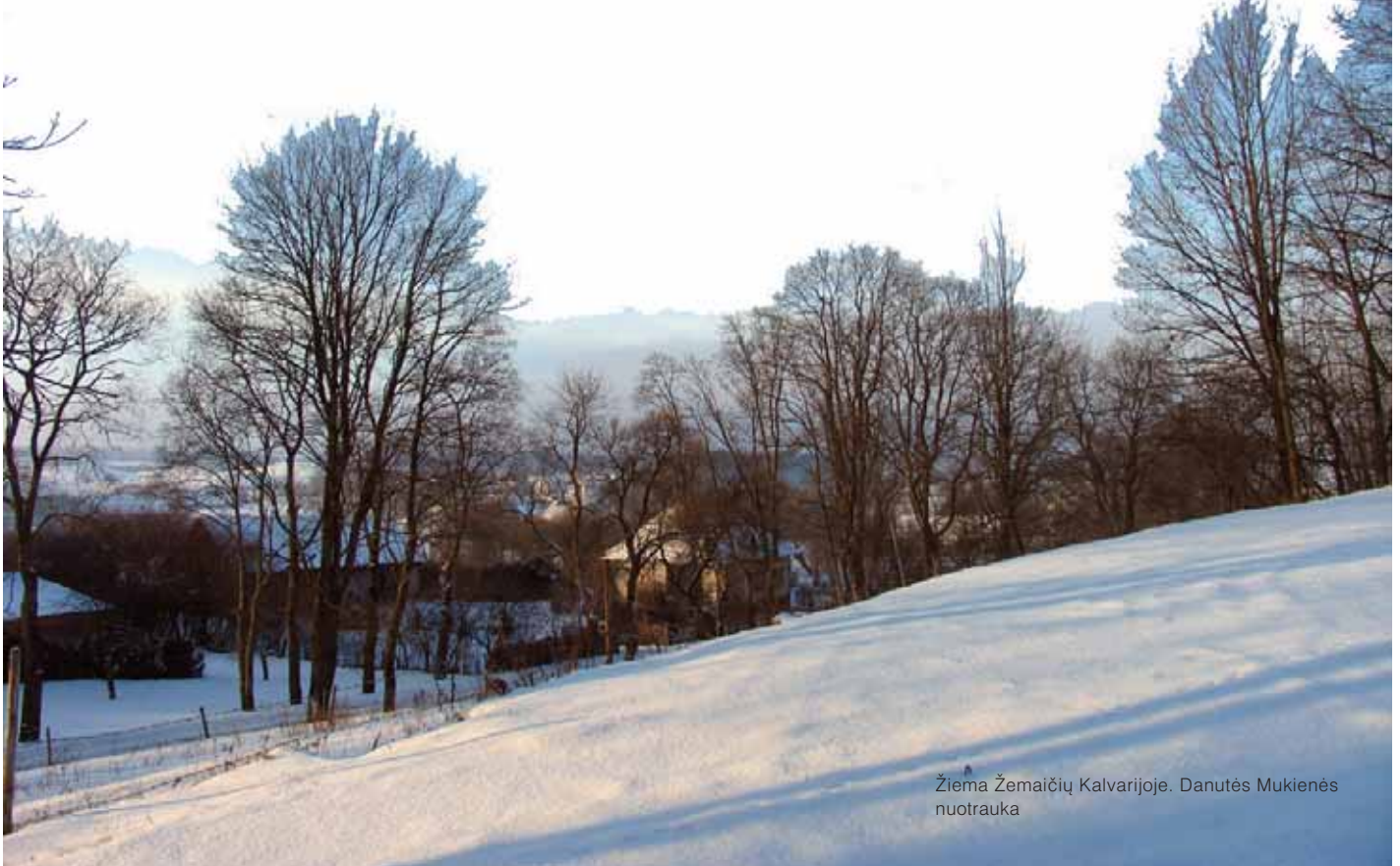
Žiema Žemaičių Kalvarijoje.