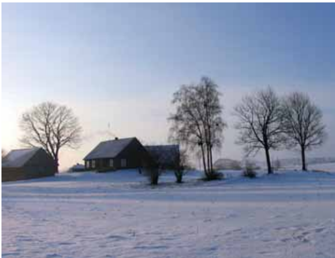
Žiema Žemaičių Kalvarijoje.