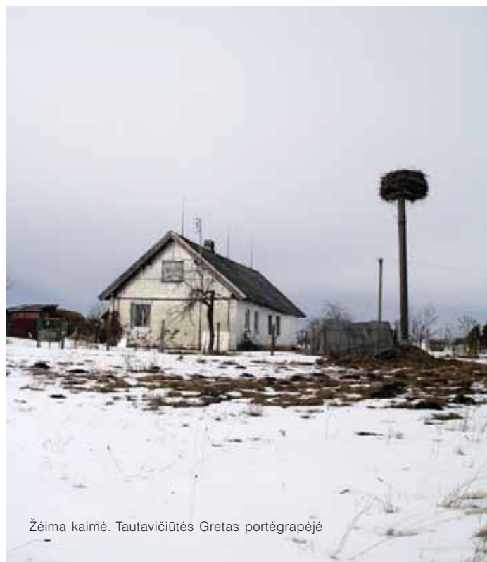
Žėima kaimė.