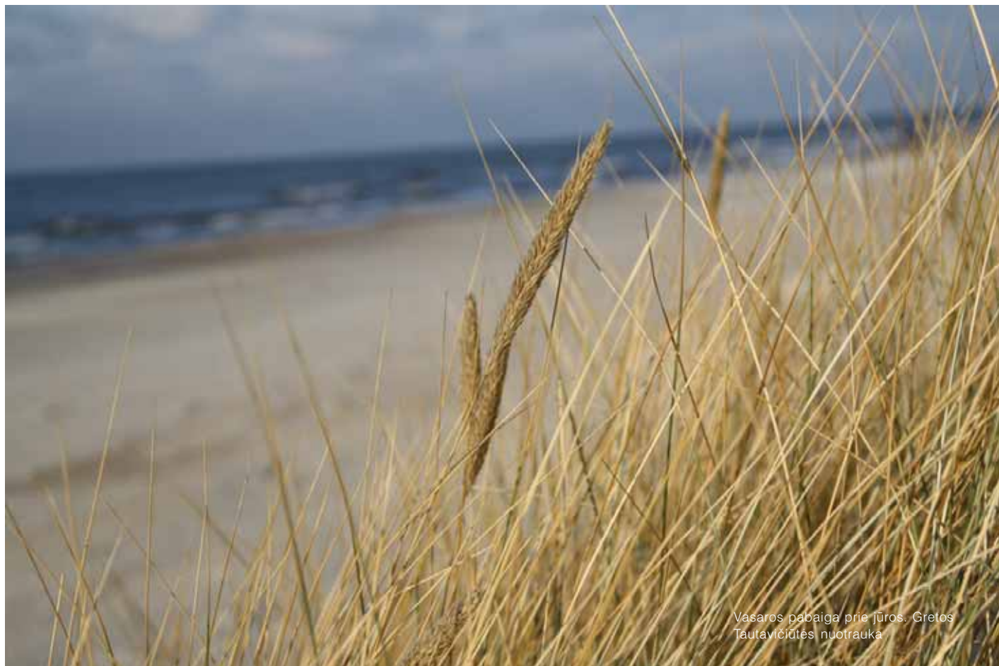
Vasaros pabaiga prie jūros.